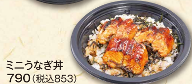
ミニうなぎ丼 790(税込853)