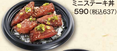
ミニステーキ丼 590(税込637)