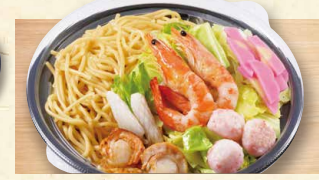
海鮮ちゃんぽん 1,030(税込1112)