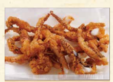
いかゲン揚げ 580(税込626)