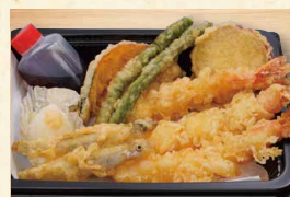
天ぷら盛り合わせ 880(税込950)