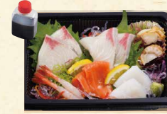
刺身盛り合わせ 1,080(税込1166)