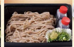
ざるそば/ざるうどん 各590(税込637)