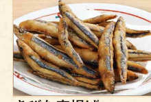
きびな唐揚げ 390(税込421)