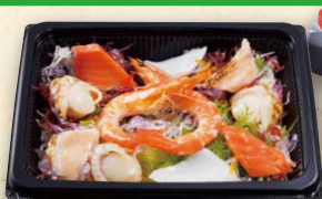
海ぞくサラダ 780(税込842)