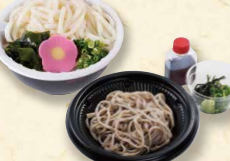
ミニうどん/ミニそば ミニざるうどん/ミニざるそば 各320(税込345)