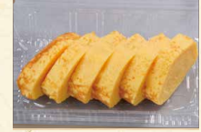
だし巻き玉子 390(税込421)