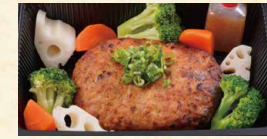
和風ハンバーグ 1,190(税込1285)