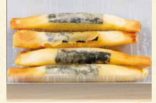
チーズフライ 390(税込421)