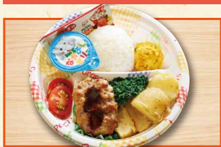
おこさまべんとう 630(税込680)