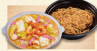
海鮮皿うどん 1,030(税込1112)