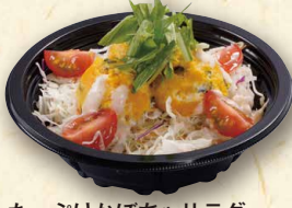
たっぷりかぼちゃサラダ 380(税込410)