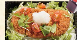
野菜たっぷりおろしカツ単品 880(税込950)