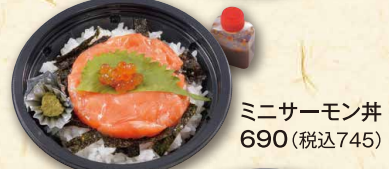
ミニサーモン丼 690(税込745)