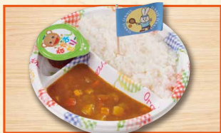
おこさまカレー 590(税込637)