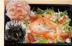
サラダうどん 680(税込734)