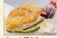
ちょっと天ぷら 430(税込464)