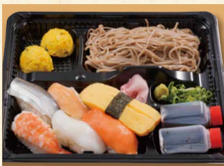
寿司ざるそば弁当