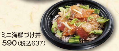
ミニ海鮮つけ丼 590(税込637)