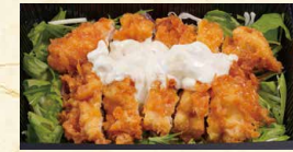
野菜たっぷり チキン南蛮単品 630(税込680)