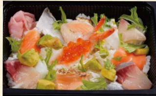
海鮮バラちらし 1,130(税込1220)