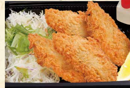
松浦アジフライ 990(税込1069)