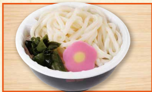
おこさまうどん 360(税込388)