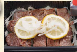
佐世保レモンステーキ