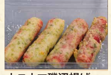
カニカマ磯辺揚げ 390(税込421)