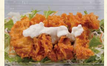
ミニチキン南蛮 390(税込421)