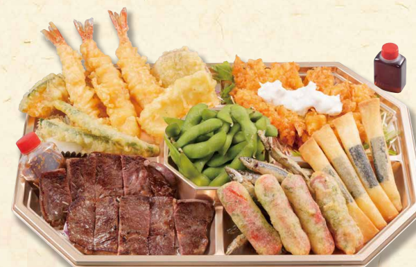
特選オードブル (3人前)