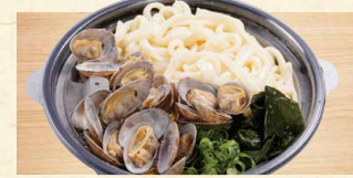
あさりうどん 790(税込853)