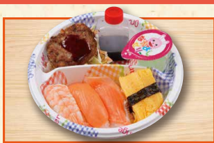
おこさますし 780(税込842)