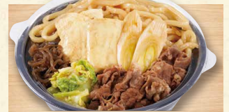
すき焼きうどん 990(税込1069)