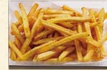
フライドポテト(のり塩) 390(税込421)