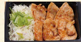
しょうが焼き単品 730(税込788)