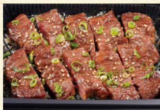
ステーキ重 990 (税込1069)