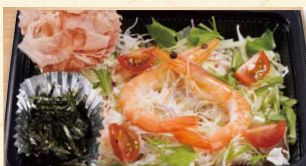
サラダうどん 680 (税込734)