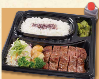
ステーキ弁当 1,130 (税込1220)

※ごはんは容器の関係上、量の変更ができません。 ※お持ち帰りのメニューの一部は、グランドメニューと価格や量が異なります。 ※生ものについてはお早めにお召し上がり下さい。高温の場所、長時間の放置による品質の劣化については責任を負いかねます。