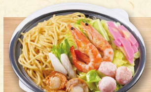
海鮮ちゃんぽん 1,030 (税込1112)