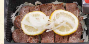
佐世保レモンステーキ 990 (税込1069)