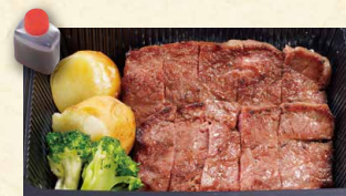
ステーキ 890 (税込961)