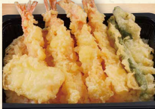
海老天丼 930 (税込1004)