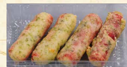
カニカマ磯辺揚げ 390 (税込421)