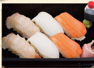
寿司6貫 530 (税込572)