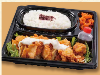
チキン南蛮弁当 880 (税込950)