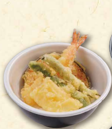
ミニ天丼 590 (税込637)