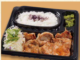
しょうが焼き弁当 780 (税込842)