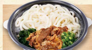
肉うどん 790 (税込853)