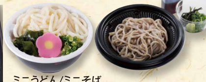
ミニうどん/ミニそば ミニざるうどん/ミニざるそば 各320 (税込345) ※麺はそばと同じ金でゆでています。