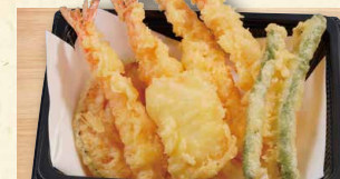
天ぷら盛り合わせ 780 (税込842)