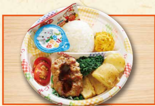
おこさまべんとう 630(税込680)