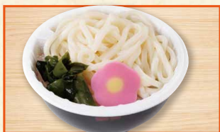
おこさまうどん 360(税込388)