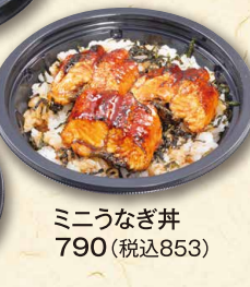
ミニうなぎ丼 790 (税込853)