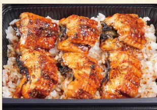
うな重 1480 (税込1598)