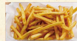
フライドポテト(のり塩) 390 (税込421)