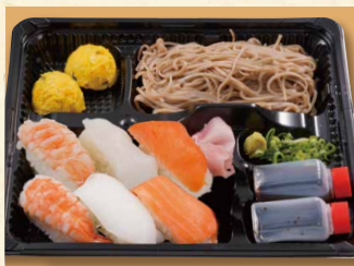
寿司ざるそば弁当 890 (税込961)