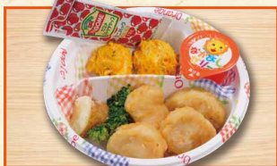
おこさまチキンナゲット 630(税込680)