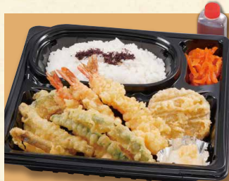
天ぷら弁当 980 (税込1058) ※天ぷらネタは変わる場合がございます。