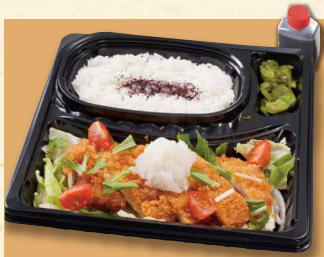
おろしカツ弁当 950 (税込1026)