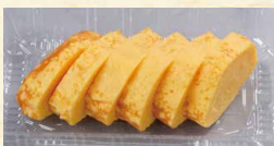
だし巻き玉子 390 (税込421)