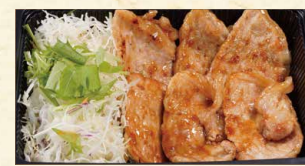
しょうが焼き単品 580 (税込626)