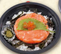
ミニサーモン丼 690 (税込745)