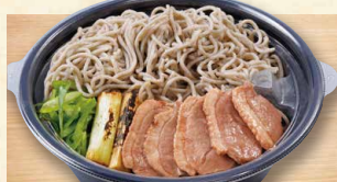
鴨南蛮そば 780 (税込842)