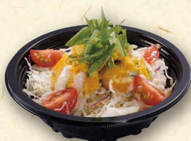
たっぷりかぼちゃサラダ 380(税込410)