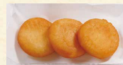
もちチーズ 580 (税込626)