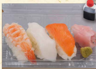
寿司3貫 390 (税込421)