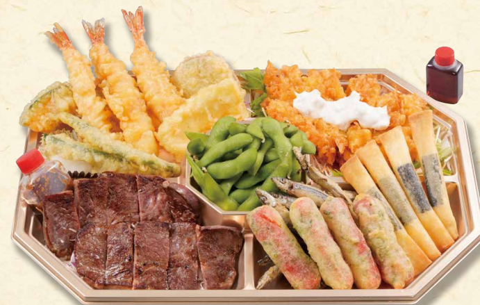
特選オードブル(3人前) 3,490 (税込3769)