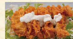
ミニチキン南蛮 390 (税込421)