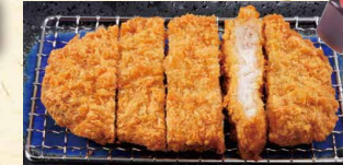
とんかつ 690 (税込745)