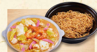
海鮮皿うどん 1,030 (税込1112)