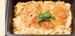
かつ鍋 580 (税込626)