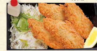
松浦アジフライ 990 (税込1069)