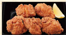
からあげ(5個) 690 (税込745)