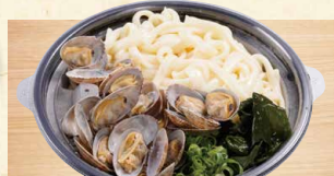
あさりうどん 790 (税込853)