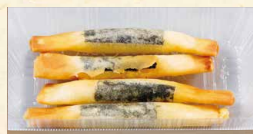
チーズフライ 390 (税込421)