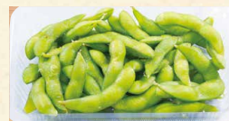
枝豆 290 (税込313)