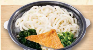
庄屋うどん 590 (税込637)