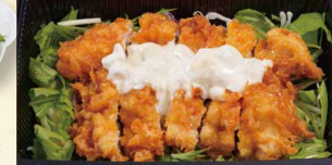
野菜たっぷり チキン南蛮単品 630 (税込680)