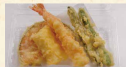
ちょっと天ぷら 430 (税込464)