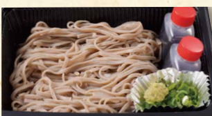
ざるそば/ざるうどん 各590 (税込637)