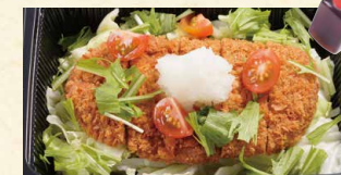
野菜たっぷりおろしカツ単品 880 (税込950)