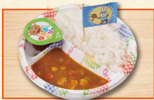
おこさまカレー 590(税込637)