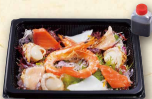
海ぞくサラダ 790(税込853)