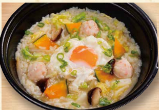
庄屋おじゃ 780 (税込842)