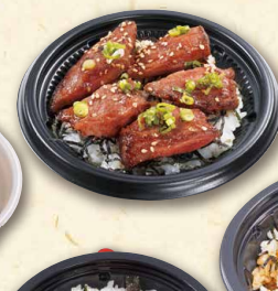
ミニステーキ丼 580 (税込626)