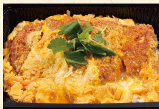
かつ丼 790 (税込853)