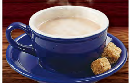
【カフェラテ】 Caffe Latte ¥649