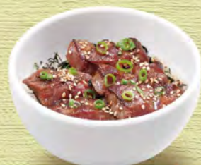
ミニステーキ丼 Mini Steak Bowl ¥638