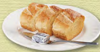
バゲット baguette ¥253