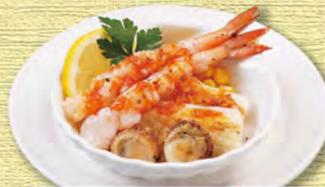
海鮮グリル Grilled Seafood ¥638