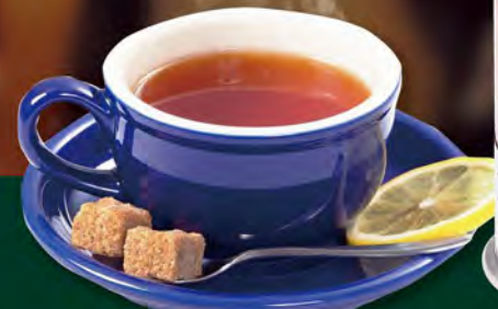
【紅茶(ダージリン)】 Darjeeling Tea ¥649