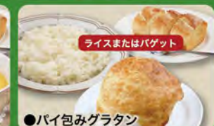
●パイ包みグラタン Pie-wrapped gratin set meal (Rice or Baguette & Pie-wrapped gratin) ¥715