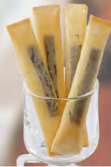
チーズスティック cheese stick ¥528