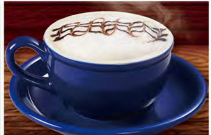
【カフェモカ】 Caffe Mocha ¥649