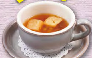
オニオンカブスープ onion soup ¥220