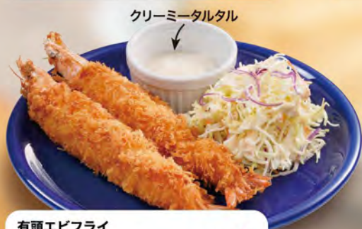
有頭エビフライ Fried shrimp with head ¥748