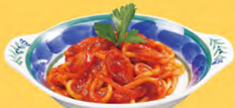
ミニナポリタン Mini Spaghetti Neapolitan