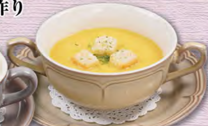
コーンポタージュ (ボウル) Corn potage (bowl) ¥330