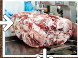
② 厳選した牛肉から更に余分な部分をカット