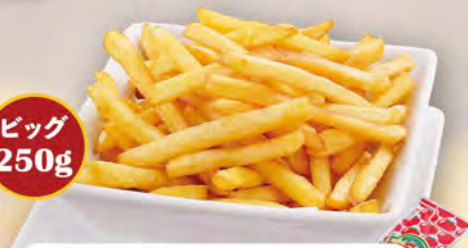
大盛りポテト Large serving of French fries ¥605