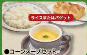
●コーンスープセット Corn Soup Set (Rice or Baguette & Corn Cup Soup) ¥385