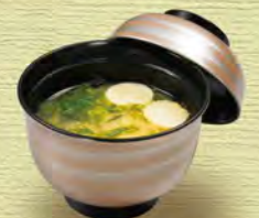
お味噌汁 miso soup ¥242