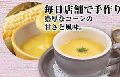
コーンカブスープ corn soup ¥253