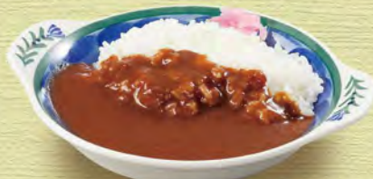
ミニカレーライス Mini Curry Rice ¥473