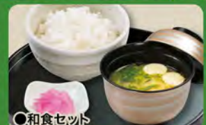
○和食セット Rice & Miso Soup Set ¥385

※Pay an extra ¥55 for large rice. ※Pay ¥33 less for small rice.