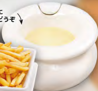
チーズポテト Cheese fondue & fries ¥968