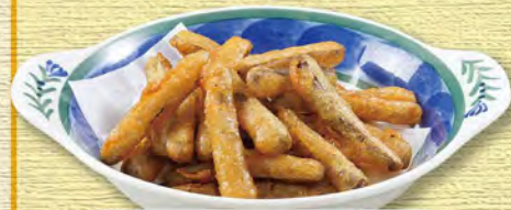
ごぼうの唐揚げ Fried Burdock ¥583