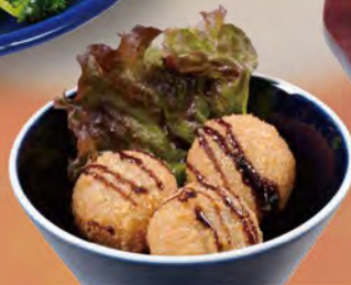
ライスコロッケ トリュフ風味 Rice Croquettes with Truffle ¥583