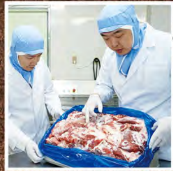
① 当社取締役が、提携工場の材料の品質チェックを定期的の実施