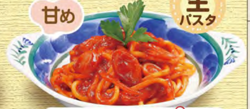
ミニナポリタン Mini Spaghetti Neapolitan seasoned w/ Ketchup ¥638