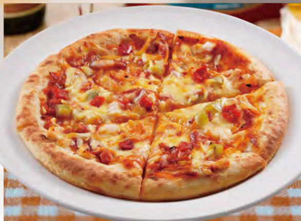
ミックスピザ mixed pizza (直径20cm) ¥968