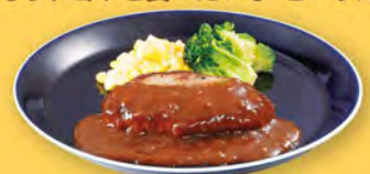
ミニハンバーグ Mini Hamburger Steak