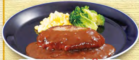
ミニハンバーグ Mini Hamburger Steak ¥473