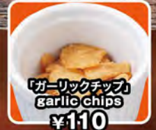
「ガーリックチップ」 garlic chips ¥110