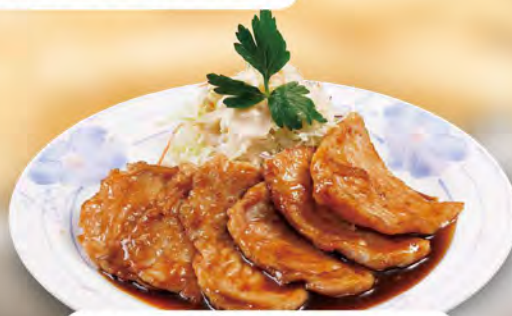
特製しょうが焼き Special Ginger-Fried Pork ¥858