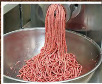
④ 厳しい選定と処理を経て、上質な挽肉の出来上がり