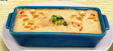
ミニグラタン Mini Gratin ¥583 ※器は熱くなっておりますのでご注意ください。