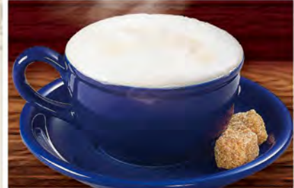
【カプチーノ】 Cappuccino ¥649