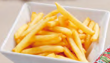
フライドポテト French fries ¥429