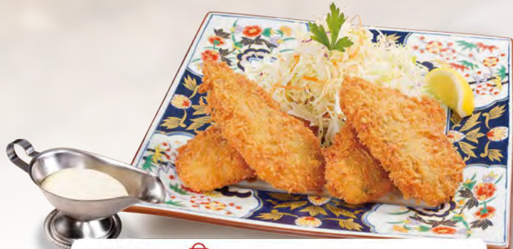
松浦アジフライ Matsuura Fried Horse Mackerel ¥1100