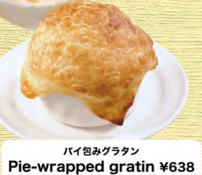
パイ包みグラタン Pie-wrapped gratin ¥638