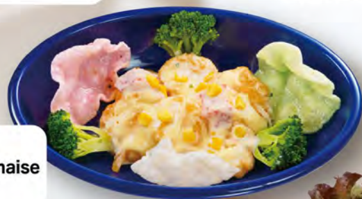
えびマヨ Shrimp mayonnaise ¥1089