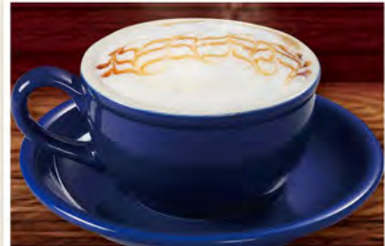
【キャラメルカプチーノ】 Caramel Cappuccino ¥649