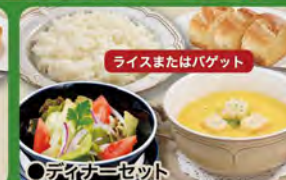
●ディナーセット Dinner Set (Rice or Baguette, Salad & Soup in a bowl) ¥638