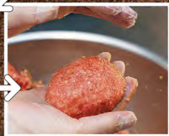
⑤ 毎日各店舗に届けられ、キッチンにて一つ一つ丁寧に手ごねされます