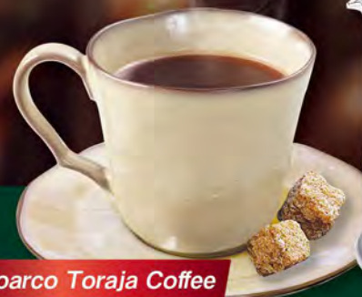
Toarco Toraja Coffee 【フレンチプレス珈琲】 French Press Coffee ¥649

ヒマラヤ山脈の高地で栽培される茶葉、 ダージリンの上品で芳醇な香りと風味を フレンチプレスでお楽しみください。