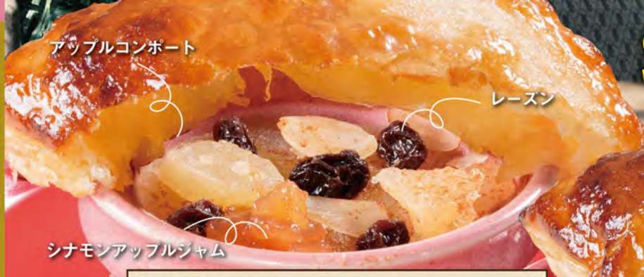
アップルコンポート