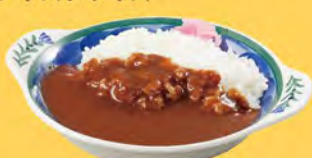
ミニカレー Mini Curry Rice