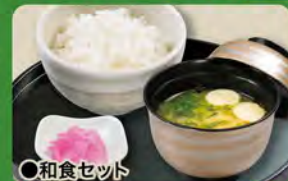
●和食セット Rice & Miso Soup Set ¥385

※Pay an extra ¥55 for large rice. ※Pay ¥33 less for small rice.