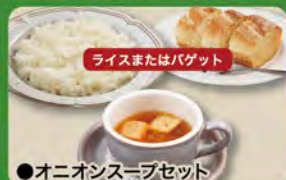
●オニオンスープセット Onion Soup Set (Rice or Baguette & Onion Cup Soup) ¥352