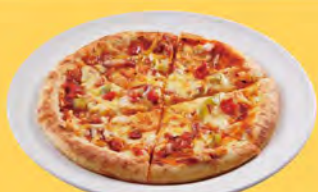
ミックスピザ mixed pizza