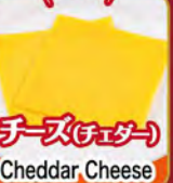
チーズ(チェダー) Cheddar Cheese