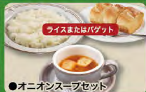
●オニオンスープセット Onion Soup Set (Rice or Baguette & Onion Cup Soup) ¥352