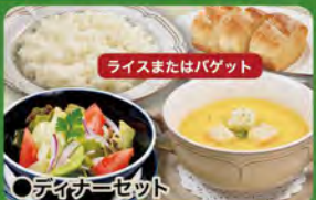
●ディナーセット Dinner Set (Rice or Baguette, Salad & Soup in a bowl) ¥638