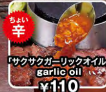
「サクサクガーリックオイル」 garlic oil ¥110