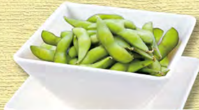
枝豆 Green Soybeans ¥495