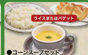
●コーンスープセット Corn Soup Set (Rice or Baguette & Corn Cup Soup) ¥385