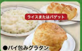
●パイ包みグラタン Baked Gratin in Pie Set (Rice or Baguette & Baked Gratin in Pie Set) ¥715