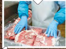
③ 挽肉にするためにスライスし、肉質にばらつきがないよう整える