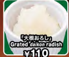
「大根おろし」 Grated daikon radish ¥110