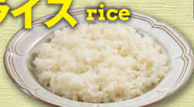
ライス rice (large)¥308 (medium)¥253 (small)¥220