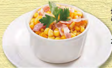
バターコーン Butter Corn ¥429