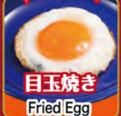
目玉焼き Fried Egg