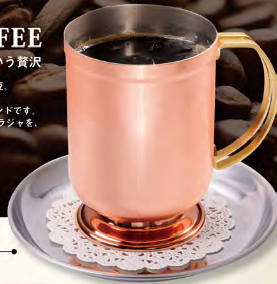
【アイス珈琲】 Iced Coffee ¥429

キーコーヒーの最高峰「トアルコトラジャ」をドリップした、 雑味がない最高品質のコーヒー。