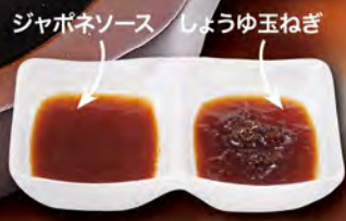
ジャポネソース しょうゆ玉ねぎ