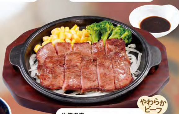
牛焼き肉 Grilled Beef ¥1232