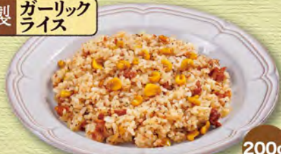
ガーリックライス garlic rice ¥418