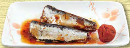
いわしの梅煮 690 (税込759)