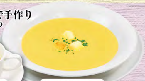
コーンポタージュ 300 (税込330)