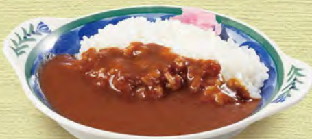
ミニカレーライス 430 (税込473)