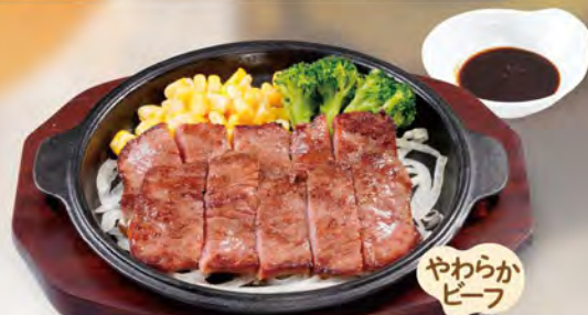
牛焼肉 1120 (税込1232)