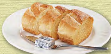
パン(バゲット) 230 (税込253)