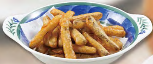
ごぼうの唐揚げ 530 (税込583)