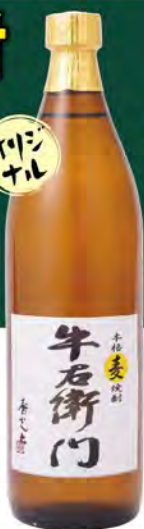
ストレート ロック 水割り ソーダ割り 麦焼酎 「牛右衛門」 (グラス) 490 (税込539) (ボトル900ml) 3800 (税込4180)