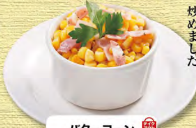
バターコーン 390 (税込429)