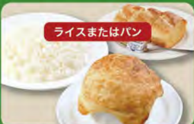
パイ包みグラタンセット 650 (税込715)