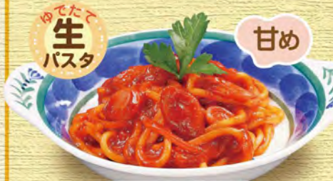
ミニナポリタン 580 (税込638)