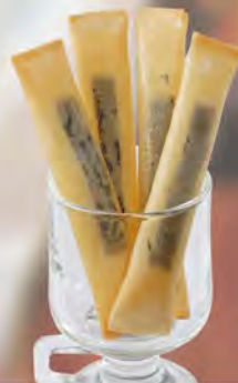
チーズスティック 480 (税込528)