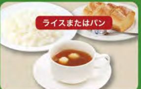
オニオン スープセット 320 (税込352)