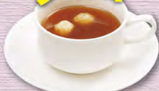
オニオンカップスープ 200 (税込220)