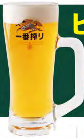
生ビール(中ジョッキ) 690 (税込759)