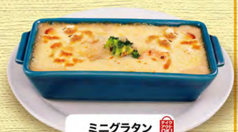
ミニグラタン 530 (税込583)