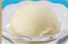
バニラアイス 290 (税込319)