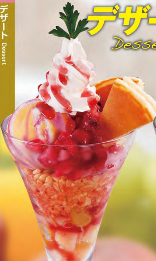
莓マーブルパフェ 690 (税込759)