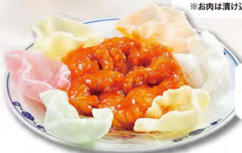
エビのチリソース 990 (税込1089)