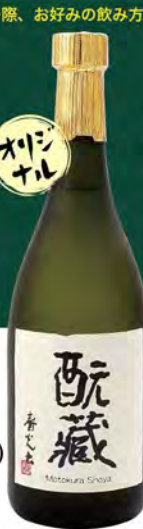
ストレート ロック 水割り ソーダ割り 芋焼酎 「蔵」 (グラス) 490 (税込539) (ボトル720ml) 2900 (税込3190)