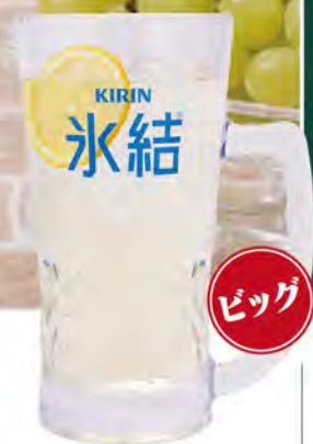
シャルドネサワー 490 (税込539)