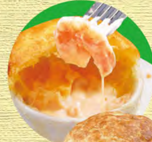
パイ包みグラタン 580 (税込638)