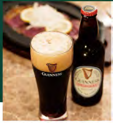
黒ビール 950(税込1045) (小びん・330ml) 【ギネス エクストラスタウト】

熟成された甘みと苦み 香ばしさが絶妙に調和した 奥深い味わいが 特徴の黒ビール。