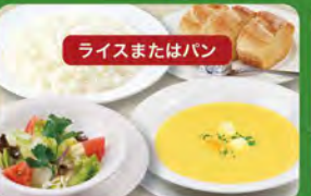
ディナーセット 580 (税込638)