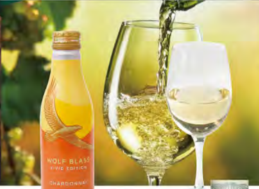
NEW! 白ワイン (250ml) 1190 (税込1309) 【ウルフブラス】