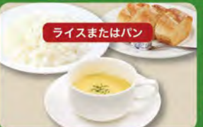
コーンスープセット 350 (税込385)