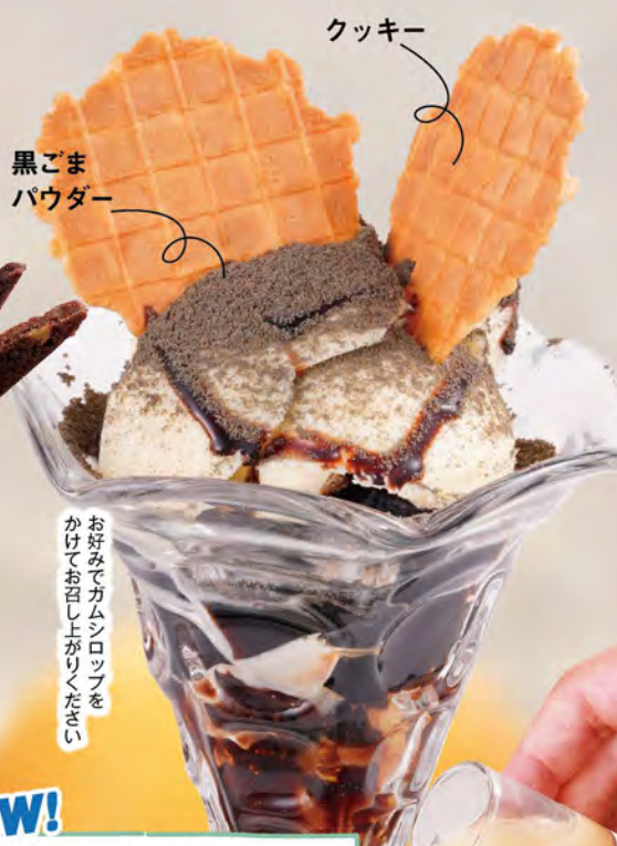
NEW! ブラックコーヒーゼリーパフェ 690 (税込759)