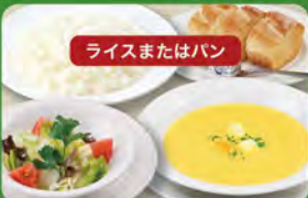
ディナーセット 580 (税込638)