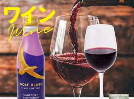
NEW! 赤ワイン (250ml) 1190 (税込1309) 【ウルフブラス】