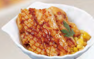
イカバター 390 (税込429)