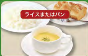
コーンスープセット 350 (税込385)