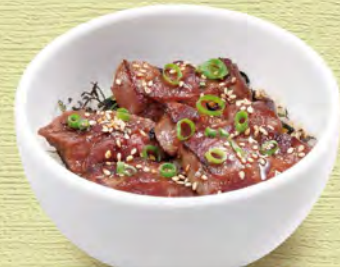
ミニステーキ丼 580 (税込638)