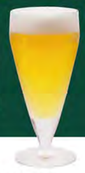
生ビール(グラス) 490 (税込539)