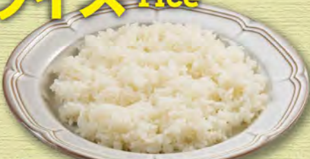
ライス(ごはん) (大) 280 (税込308) (中) 230 (税込253) (小) 200 (税込220)