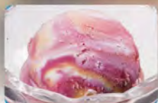
ビビッドマーブルアイス 290 (税込319)