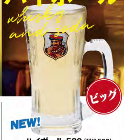
NEW! ハイボール 530 (税込583) 【ブラックニッカ】