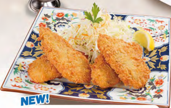
松浦アジフライ 1000 (税込1100)