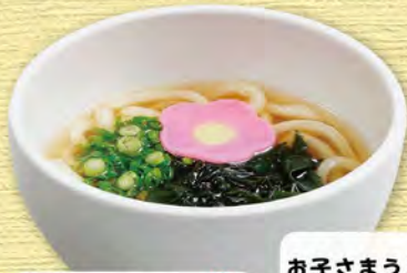
ミニうどん 320 (税込352)