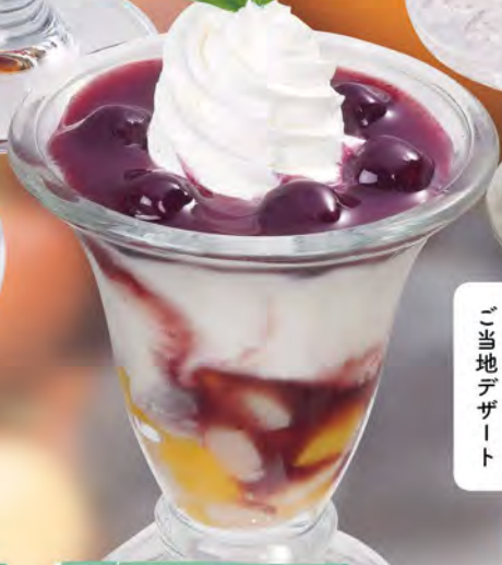
ブルーベリー ヨーグルトパフェ 480 (税込528)