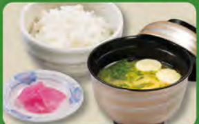
和食セット 350 (税込385)

お得なセットのライス(ごはん)は +165円税込でガーリックライスにかえられます。