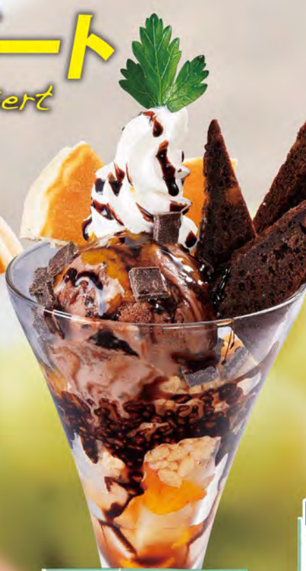
特製チョコパフェ 730 (税込803)