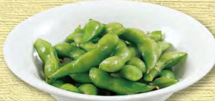
枝豆 450 (税込495)