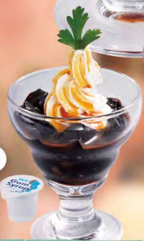
ミニコーヒーゼリー 300 (税込330) お好みでガムシロップをどうぞ。