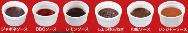
ジャポネソース BBQソース レモンソース しょうゆ玉ねぎ 和風ソース ジンジャーソース