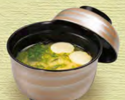
おみそ汁 220 (税込242)