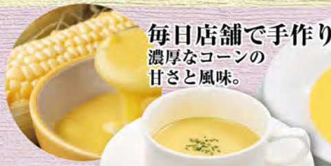
コーンカップスープ 230 (税込253)