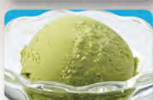
宇治抹茶アイス 290 (税込319)