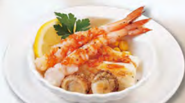
海鮮グリル 580 (税込638)