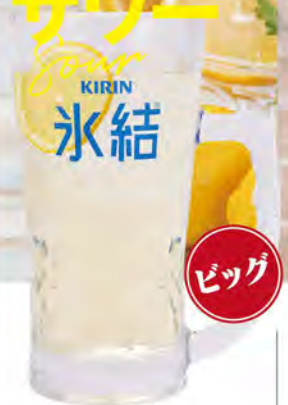
レモンサワー 490 (税込539)