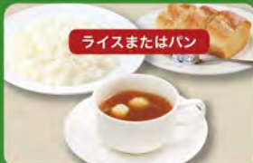
オニオンスープセット 320 (税込352)