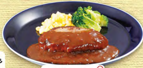
ミニハンバーグ 430 (税込473)