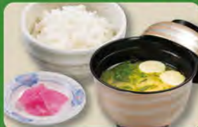
和食セット 350 (税込385)

○ライスは+55円税込で大盛りにできます。 ○ライスは-33円税込で小盛りにできます。