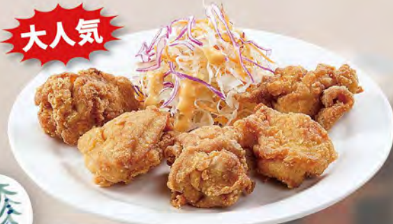
フライドチキン(5個) 580 (税込638)