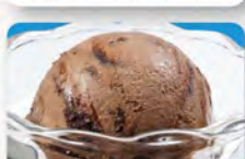
チョコアイス 290 (税込319)