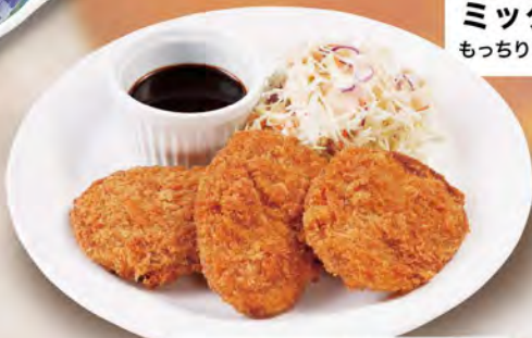
ヒレカツ 480 (税込528)