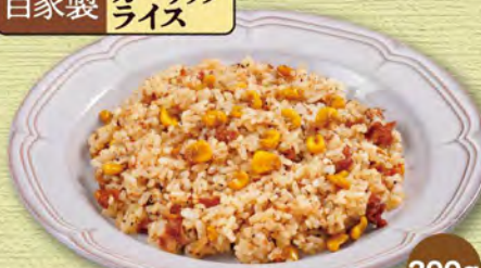
ガーリックライス 380 (税込418)