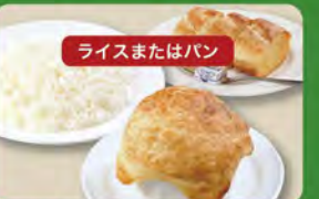
パイ包みグラタンセット 650 (税込715)