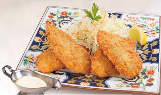
松浦アジフライ 1000 (税込1100)