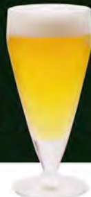
生ビール(グラス) 490(税込539)