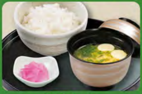
和食セット 350 (税込385)

○ライスは+55円税込で大盛りにできます。 ○ライスは-33円税込で小盛りにできます。