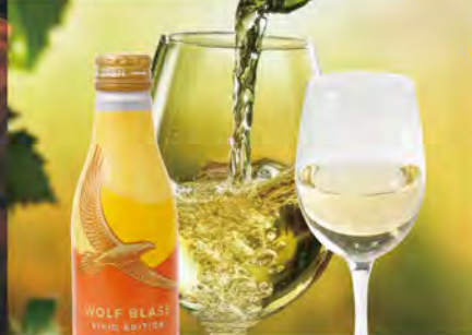
白ワイン(250ml) 1190(税込1309) 【ウルフプラス】