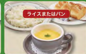
コーンスープセット 350 (税込385)