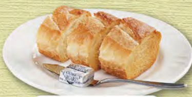
パン(バゲット) 230 (税込253)