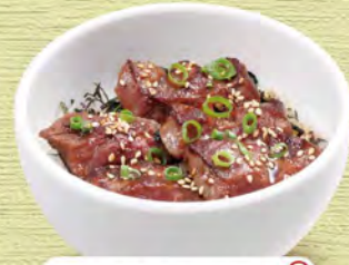
ミニステーキ丼 580 (税込638)