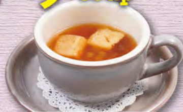
オニオンカップスープ 200 (税込220)