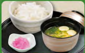
和食セット 350 (税込385)

○ライスは+55円税込で大盛りになれます。 ○ライスは-33円税込で小盛りになれます。