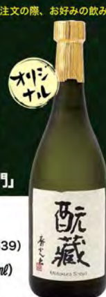
ストレート ロック 水割り 芋焼酎 「蔵蔵」 (グラス) 490(税込539) (ボトル720ml) 2900 (税込3190)