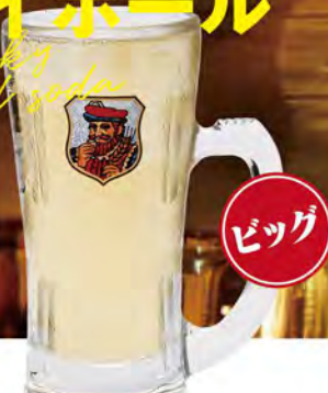
ハイボール 530(税込583) 【ブラックニッカ】