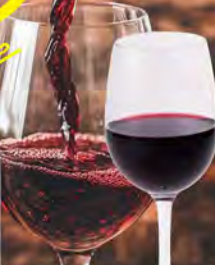
NEW! グラスワイン(赤) 490(税込539) プティモンテリア ルージュ