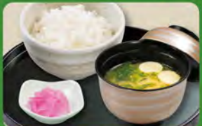
和食セット 350 (税込385)

○ライスは+55円税込で大盛りになります。 ○ライスは-33円税込で小盛りになります。