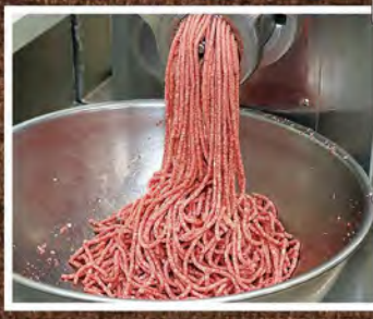
④ 厳しい選定と処理を経て、上質な挽肉の出来上がり