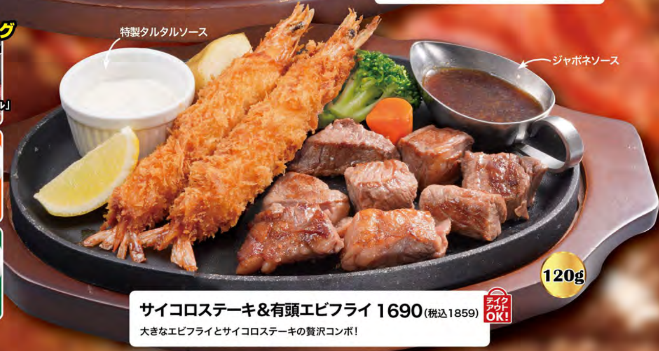
特製タルタルソース