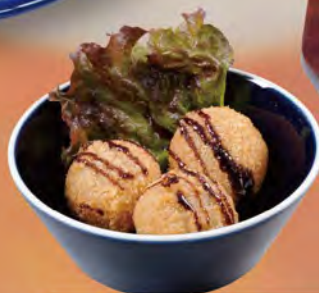
ライスコロッケ トリュフ風味 530 (税込583)