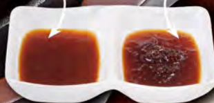
ジャポネソース しょうゆ玉ねぎ