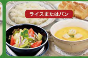
ディナーセット 580 (税込638)