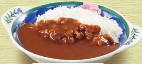
ミニカレーライス 430 (税込473)