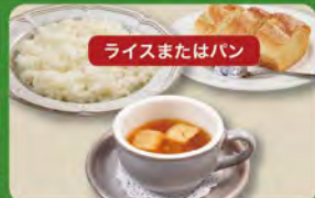
オニオンスープセット 320 (税込352)