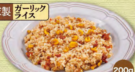
ガーリックライス 380 (税込418)