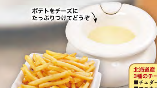
ポテトをチーズに たっぷりつけてどうぞ