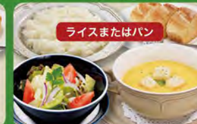
ディナーセット 580 (税込638)