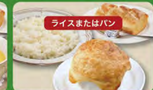
パイ包みグラタンセット 650 (税込715)