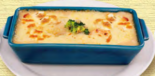
ミニグラタン 530 (税込583)