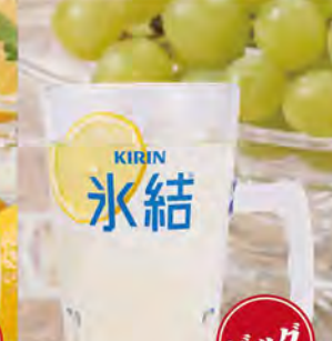
NEW! シャルドネサワー 490(税込539)