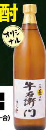
ストレート ロック 水割り 麦焼酎 「牛右衛門」 (グラス) 490(税込539) (ボトル900ml) 3800 (税込4180)