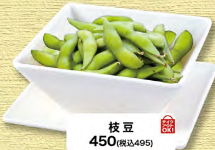
枝豆 450 (税込495)