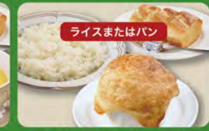
パイ包みグラタンセット 650 (税込715)