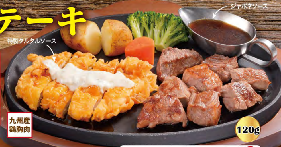
特製タルタルソース