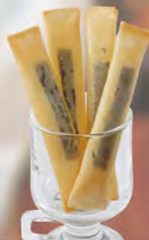
チーズスティック 480 (税込528)