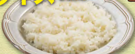
ライス(ごはん) (大) 280 (税込308) (中) 230 (税込253) (小) 200 (税込220)