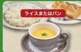
コーンスープセット 350 (税込385)