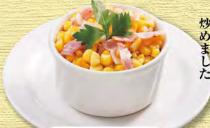
バターコーン 390 (税込429)