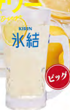
レモンサワー 490(税込539)