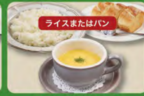
コーンスープセット 350 (税込385)