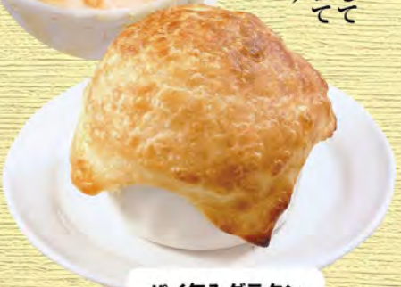
パイ包みグラタン 580 (税込638)