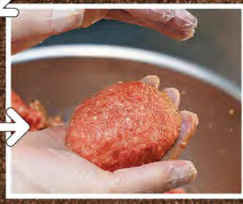
⑤ 毎日各店舗に届けられ、キッチンにて一つ一つ丁寧に手ごねされます