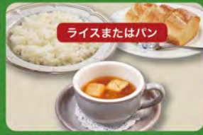
オニオンスープセット 320 (税込352)