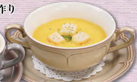
コーンポタージュ(ボウル) 300 (税込330)