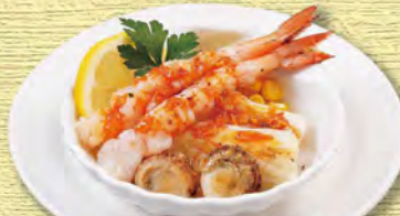
海鮮グリル 580 (税込638)