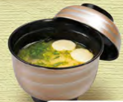
おみそ汁 220 (税込242)