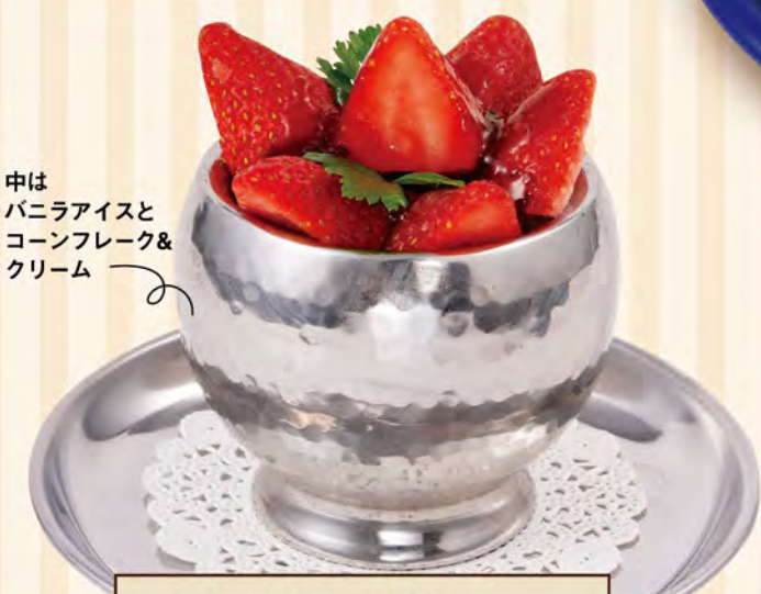
中はバニラアイスとコーンフレーク&クリーム

ムーンラビット 690 (税込759) 2羽のうさぎ型のバナナコッタに、まんまるお月様型のバニラアイス添えて。