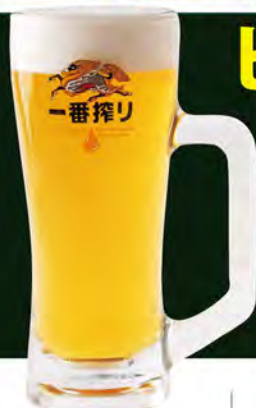
生ビール(中ジョッキ) 690(税込759)