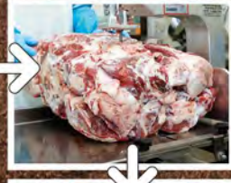
② 厳選した牛肉から更に余分な部分をカット