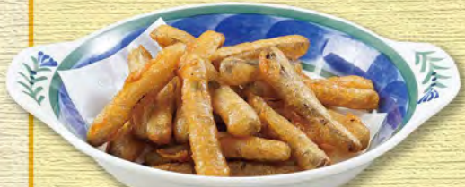
ごぼうの唐揚げ 530 (税込583)