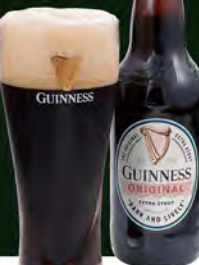
黒ビール 950(税込1045) (小びん・330ml) 【ギネス エクストラスタウト】