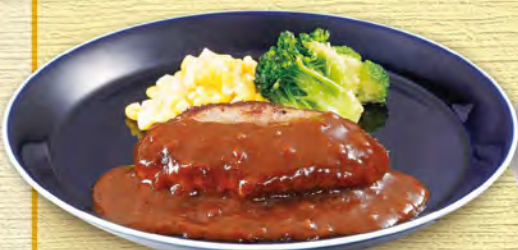
ミニハンバーグ 430 (税込473)