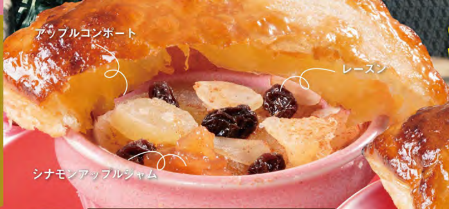
アップルコンボート