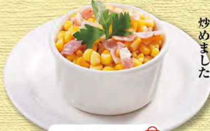
バターコーン 390 (税込429)