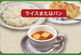
ライスまたはパン オニオンスープセット 320 (税込352)