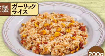
ガーリックライス 380 (税込418)