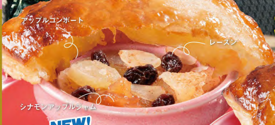
アップルコンボート