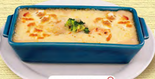
ミニグラタン 530 (税込583)