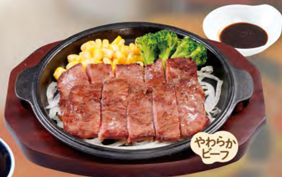
牛焼肉 1120 (税込1232)