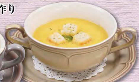
コーンポタージュ(ボウル) 300 (税込330)