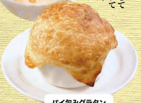
パイ包みグラタン 580 (税込638)