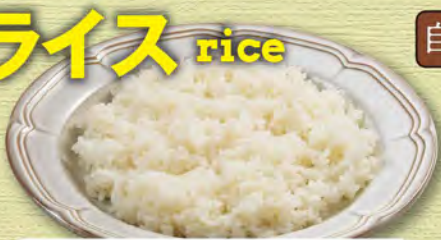
ライス(ごはん) (大) 280 (税込308) (中) 230 (税込253) (小) 200 (税込220)