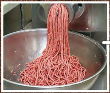
④ 厳しい選定と処理を経て、上質な挽肉の出来上がり