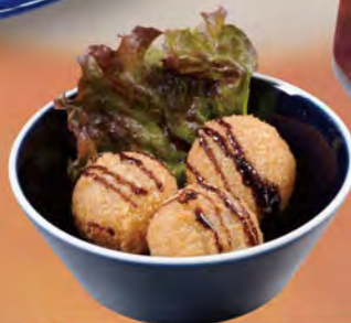
ライスコロケ トリュフ風味 530 (税込583)