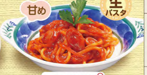
ミニナポリタン 580 (税込638)