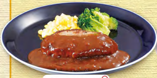
ミニハンバーグ 430 (税込473)