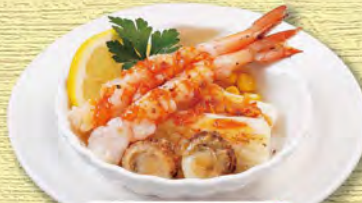
海鮮グリル 580 (税込638)