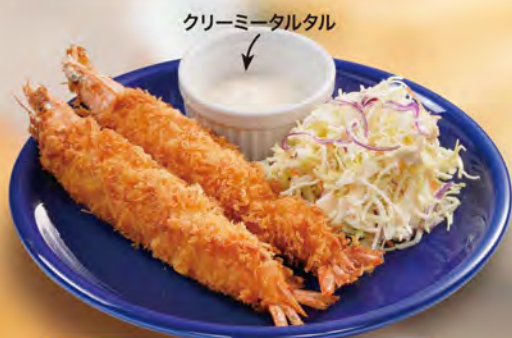
有頭エビフライ 680 (税込748)