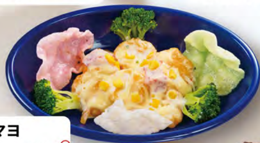
エビマヨ 990 (税込1089)