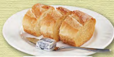
パン(バゲット) 230 (税込253)