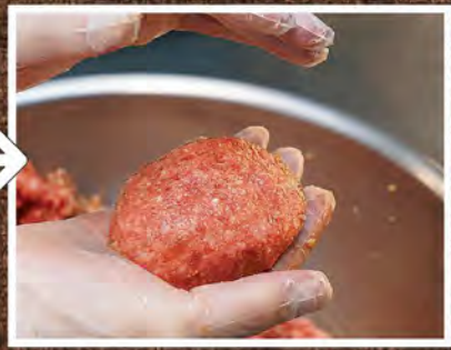
⑤ 毎日各店舗に届けられ、キッチンにて一つ一つ丁寧に手ごねされます