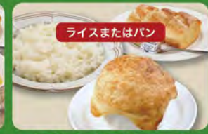
ライスまたはパン パイ込みグラタンセット 650 (税込715)