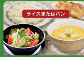
ライスまたはパン ディナーセット 580 (税込638)