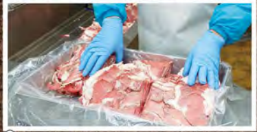
③ 挽肉にするためにスライスし、肉質にばらつきがないよう整える