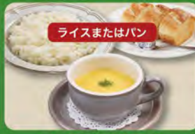
ライスまたはパン コーンスープセット 350 (税込385)