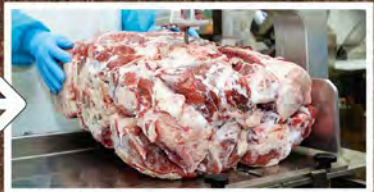
② 厳選した牛肉から更に余分な部分をカット