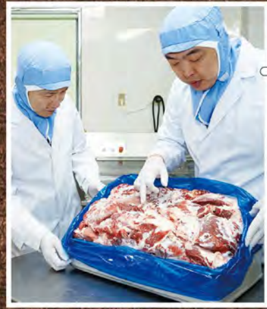
① 当社取締役が、提携工場の材料の品質チェックを定期的実施