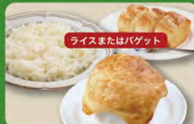
パイ包みグラタンセット