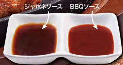
ジャポネソース BBQソース

テキサスステーキ 2980 (税込3278) 豪快に分厚くカットした牛右衛門自慢の熟成ロースステーキ!