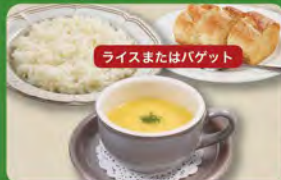
コーンスープセット