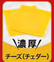
濃厚 チーズ(チェダー)