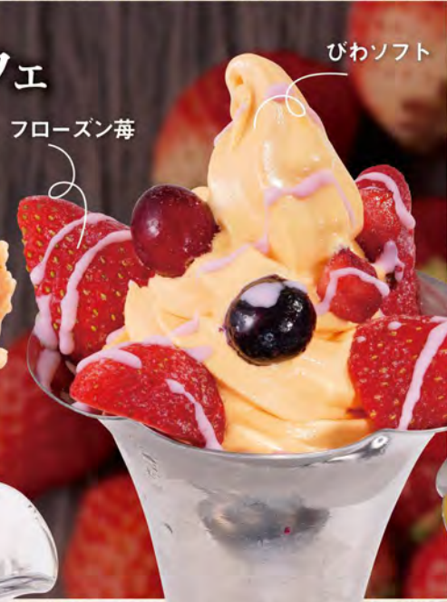
びわ苺チェリーパフェ 790(税込869) びわソフトに苺とミックスベリーをトッピング!