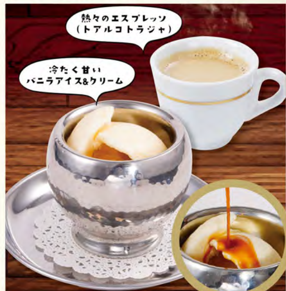
アフォガード 590 (税込649)

冷たいバニラアイスにトアルコトラジャの熱々エスプレッソをかけてお召し上がりください。