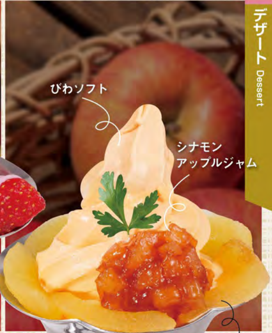
びわ林檎パフェ 790(税込869) シナモンの香るシックな大人の味わい。