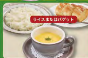
コーンスープセット