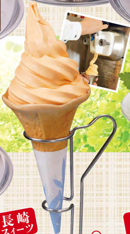
長崎スイーツ びわソフトクリーム 430(税込473) 口溶けなめらか&濃厚なびわの風味♪