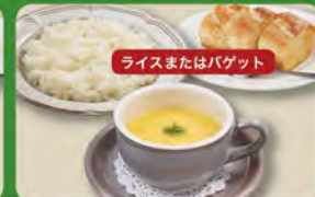
コーンスープセット 330(税込363)