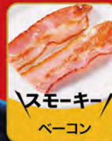
スモーキー ベーコン