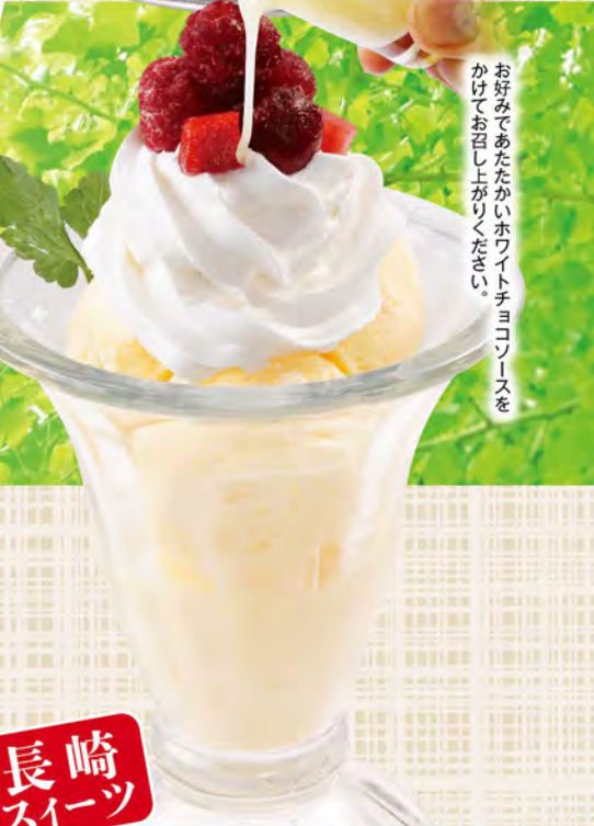
長崎スイーツ 食べるミルクセーキ 490(税込539) 長崎のミルクセーキはシャリシャリ食感、スプーンで食べるフローズンデザートです。