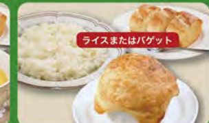
パイ包みグラタンセット 580(税込638)