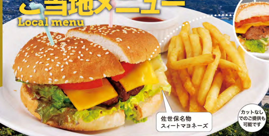
佐世保名物 スイートマヨネーズ