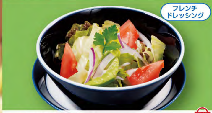
フレンチドレッシング