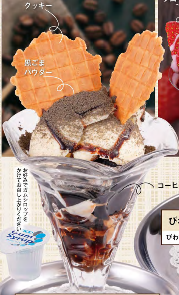
ブラックコーヒーゼリーパフェ 690(税込759) ビターな珈琲ゼリーとバニラアイスのパフェ