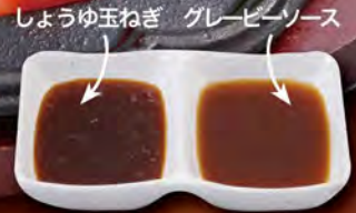
しょうゆ玉ねぎ グレービーソース