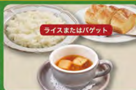
オニオンスープセット