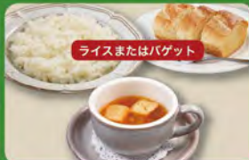
オニオンスープセット