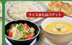
ディナーセット 530(税込583)