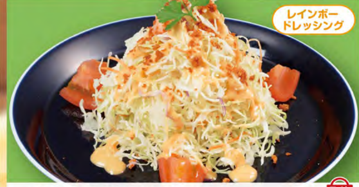
レインボードレッシング