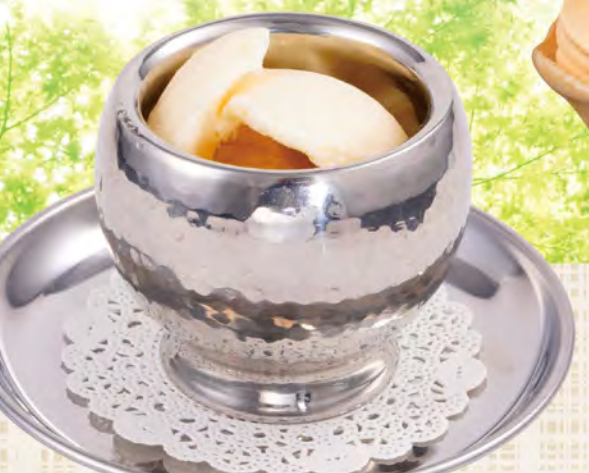
マダガスカルバニラアイス 320(税込352)