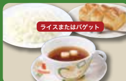
【オニオンスープセット】 Onion Soup Set (Rice or Baguette & Onion Cup Soup) 洋葱汤套餐 / 양파 수프 세트 ¥308