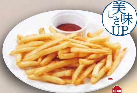
[フライドポテト] French Fries 炸薯条 / 후렌치 후라이 ¥319