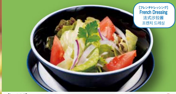
[フレンチドレッシング] French Dressing 法式沙拉酱 프렌치 드레싱

お肉にも! [ジャポネーズ] Japanese-style Dressing 日式沙拉酱 일본식 드레싱