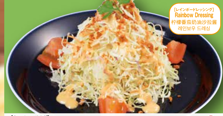
[レインボードレッシング] Rainbow Dressing 柠檬番茄奶油沙拉酱 레인보우 드레싱

[ミニサラダ] Small Salad / 小份沙拉 / 미니 샐러드 ¥220 もう一品のサラダとして。