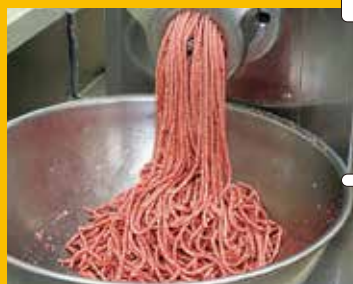
④ 厳しい選定と処理を経て、上質な挽き肉の出来上がり