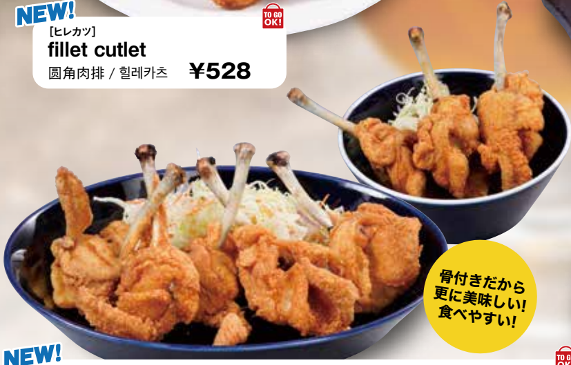
NEW! [骨付きフライドチキン] Fried Chicken with Bone 5 pieces 847 yen / 3 pieces 528 yen 炸鸡带骨 5个847日元 3个528日元 뼈가 달린 프라이드 치킨 5개입 847엔 3개입 528엔