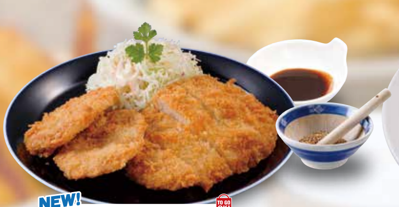
NEW! [ミックスカツ] Assorted Pork Cutlets 炸物拼盘 / 믹스 카츠 ¥781