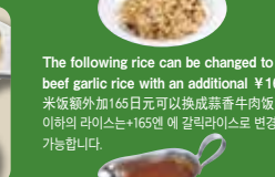
Try adding our mini curry 可以根据喜好加少许咖喱汁 취향에 따라 약간의 카레를 드셔 보세요