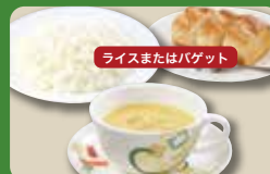
【コーンスープセット】 Corn Soup Set (Rice or Baguette & Corn Cup Soup) 玉米汤套餐 / 옥수수 수프 세트 ¥363