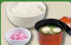
【和食セット】 Rice & Miso Soup Set 日式套餐 / 일식 세트 ¥363

Regular serving size of rice can be changed to small. [¥33 Off (incl. tax)] 米饭可以换成小份米饭(减去33日元含税) / 라이스(밥)은 라이스(소)로 변경 가능합니다.(33엔 할인) Large serving of rice is available with no additional cost. 米饭免费盛满 / 라이스(밥) 곁배기는 무료입니다.