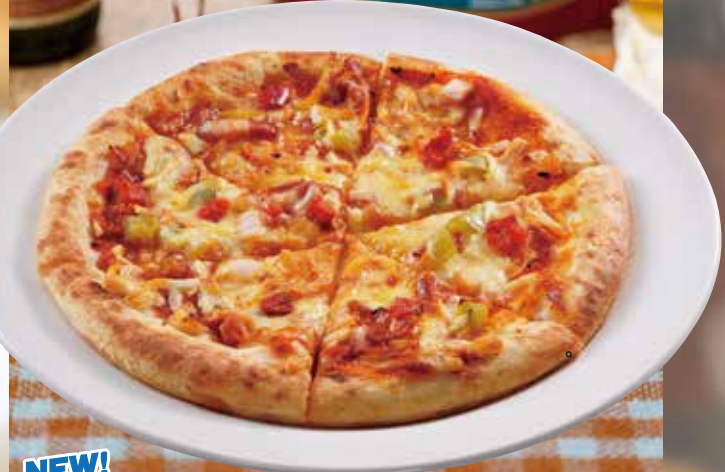
NEW! [ミックスピザ] Mix Pizza / 什锦披萨 / 믹스 피자 ¥748