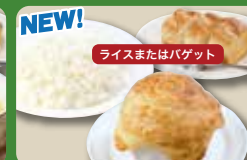
【パイ包みグラタンセット】 Baked Gratin in Pie Set 酥派裹奶汁烤菜套餐 파이 그라탕 세트 ¥638