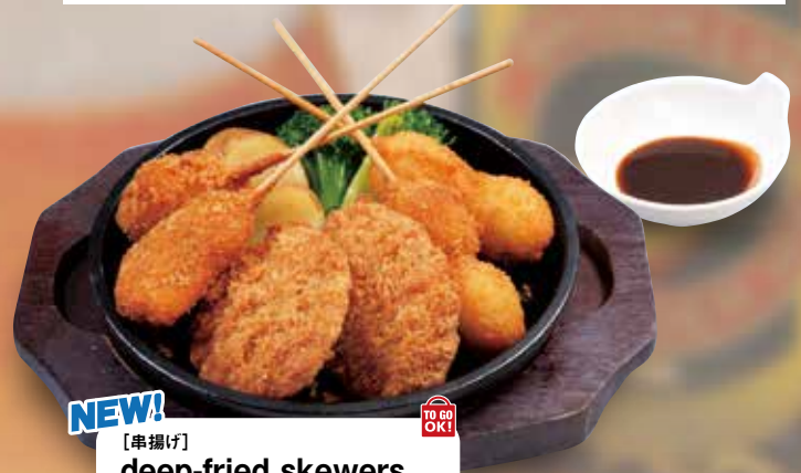
NEW! [串揚げ] deep-fried skewers 炸串 / 꼬치튀김 ¥858