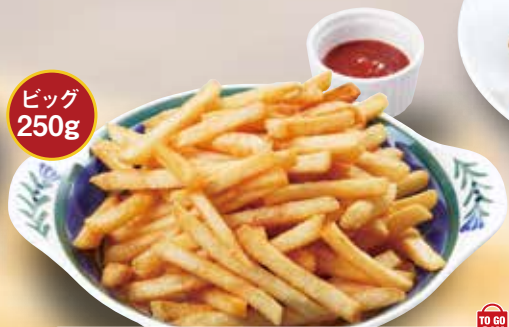
[大盛りポテト] Large French Fries 大份炸薯条 / 후렌치 후라이 곱배기 ¥473