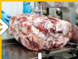
② 厳選した牛肉から更に余分な部分をカット