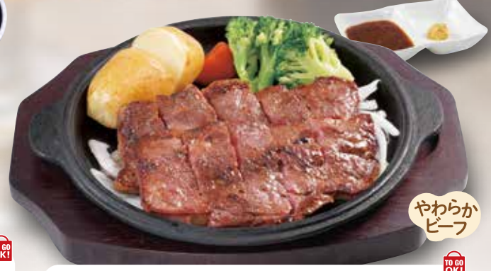
[和風ステーキ] Diced Beef Steak with Japanese Style Sauce 和风牛排 / 일본식 스테이크 ¥1089