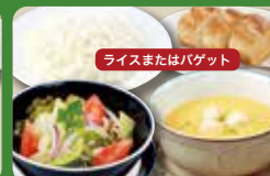
【ディナーセット】 Dinner Set (Rice or Baguette, Salad & Soup in a bowl) 晚餐套餐 / 디너 세트 ¥583