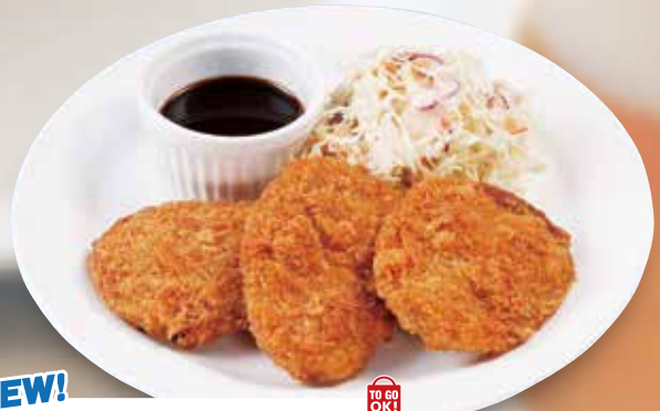
NEW! [ヒレカツ] fillet cutlet 圓角肉排 / 힐레카츠 ¥528