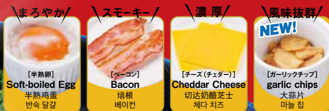
【まるやか】 Soft-boiled Egg 半熟鸡蛋 반숙 달걀