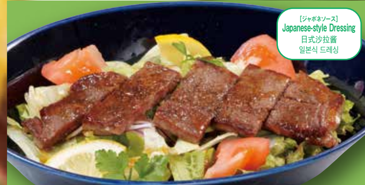
[ジャポネーズ] Japanese-style Dressing 日式沙拉酱 일본식 드레싱

[Hearty Potato Salad] Hearty Potato Salad / 分量充足的土豆沙拉 / 듬뿍 포테이토 샐러드 ¥363 たっぷりのポテトサラダは満足感あり。