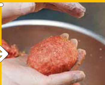
⑤ 手ごね 毎日各店舗に届けられ、キッチンにて一つ一つ丁寧に手ごねされます