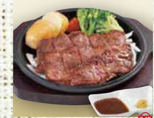
●和風ステーキ Diced Beef Steak with Japanese Style Sauce 和风牛排 / 일본식 스테이크 ¥1199