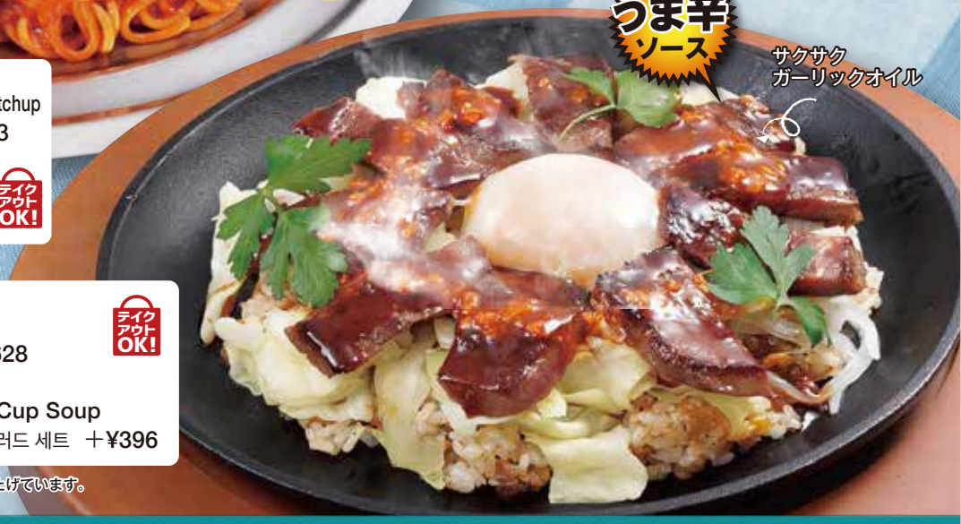
●鉄板ピラフ Pilaf on Iron Plate 铁板西式炒饭 / 철판 볶음밥 ¥1628 ●미니サラダ・オニオンスープ付き Set w/ Mini Salad & Onion Cup Soup 洋葱汤和沙拉套餐 / 양파 수프·샐러드 세트 + ¥396