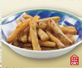
●ごぼうの唐揚げ Fried Burdock 干炸牛蒡 / 우엉튀김 ¥539