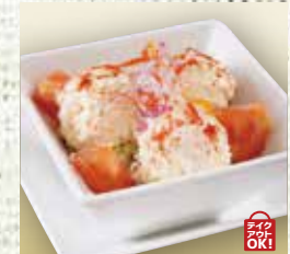
●たっぷりポテトサラダ Hearty Potato Salad 分量充足的土豆沙拉 / 듬뿍 포테이토 샐러드 ¥462