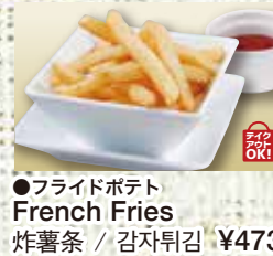
●フライドポテト French Fries 炸薯条 / 감자튀김 ¥473