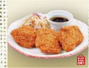
●ヒレカツ fillet cutlet 圓角肉排 / 힐레카츠 ¥638