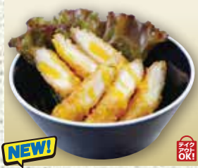
●モッツアレラチーズスティック Mozzarella Cheese Sticks 马苏里拉奶酪条 / 모짜렐라 치즈 스틱 ¥759