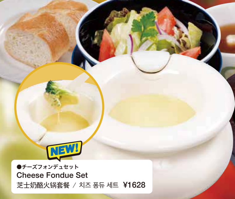
●チーズフォンデュセット Cheese Fondue Set 芝士奶酪火锅套餐 / 치즈 풍류 세트 ¥1628