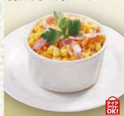
●バターコーン Butter Corn 黄油炒玉米 / 버터 콘 ¥429