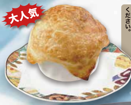
●パイ包みグラタン Baked Gratin in Pie 酥派裹奶汁烤菜 / 파이 그라탕 ¥583