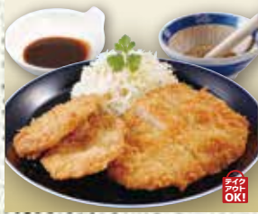
●ミックスカツ Assorted Pork Cutlets 炸物拼盘 / 믹스 카츠 ¥935