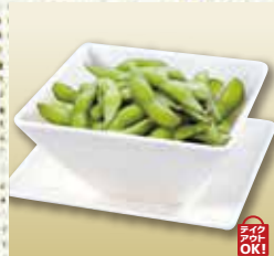
●枝豆 Green Soybeans 毛豆 / 완두콩 ¥429