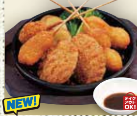
●串揚げ deep-fried skewers 炸串 / 꼬치튀김 ¥968