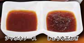
ジャポネソース しょうゆ玉ねぎ