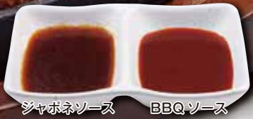
ジャポネソース BBQソース

テイクアウト テイクアウト(お持ち帰り)マークが ついたメニューはお持ち帰りできます。 Any items with "TAKE OUT" mark in the menu can be ordered to go. 有外带(打包)标志的餐品可以打包 / (テイクアウトOK)マークが 붙어있는 메뉴는 테이크아웃 가능합니다.