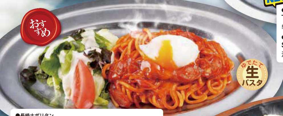
●長崎ナポリタン Nagasaki-style Spaghetti Neapolitan seasoned w/ Ketchup 长崎风味意大利面 / 나가사키풍 나폴리탄 ¥1133 ●オニオンスープ付 With Onion Soup 附赠洋葱汤 / 어니언 스프(포함) + ¥165