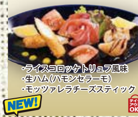
●前菜3種盛り Three kinds of appetizers 三种开胃菜 / 전체 3종 ¥1045