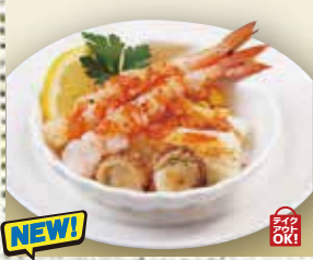
●海鮮グリル Grilled Seafood 炙烤海鲜 / 해물 그릴 ¥649