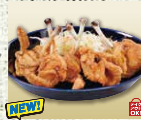
●骨付きフライドチキン (5本) Fried Chicken with Bone (5 pieces) 炸鸡带骨(3个) / 뼈가 달린 프라이드 치킨(5개) ¥935