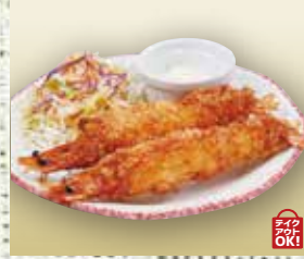
●有頭エビフライ Deep-fried Breaded Prawns with Heads 炸虾 / 새우 튀김 ¥748