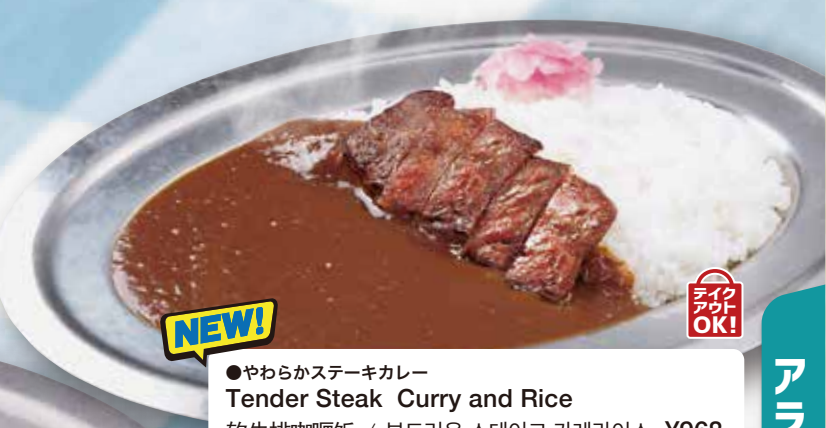
●やわらかステーキカレー Tender Steak Curry and Rice 软牛排咖喱饭 / 부드러운 스테이크 카레라이스 ¥968 ●ミニサラダ・オニオンスープ付き Set w/ Mini Salad & Onion Cup Soup 洋葱汤和沙拉套餐 / 양파 수프·샐러드 세트 + ¥396