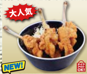
●骨付きフライドチキン (3本) Fried Chicken with Bone (3 pieces) 炸鸡带骨(3个) / 뼈가 달린 프라이드 치킨(3개) ¥594