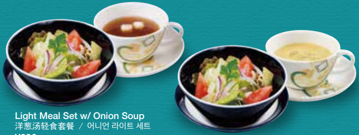
Light Meal Set w/ Onion Soup 洋葱汤轻食套餐 / 어니언 라이트 세트 ¥396