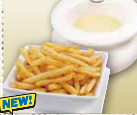
●チーズポテト Cheese & French Fries 奶酪和炸薯条 / 치즈 & 감자튀김 ¥968