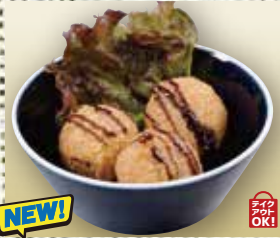
●ライスコロッケ Rice croquettes 炸丸子 / 라이스 고로케 ¥583