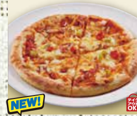
●ミックスピザ Mix Pizza 什锦披萨 / 믹스 피자 ¥814