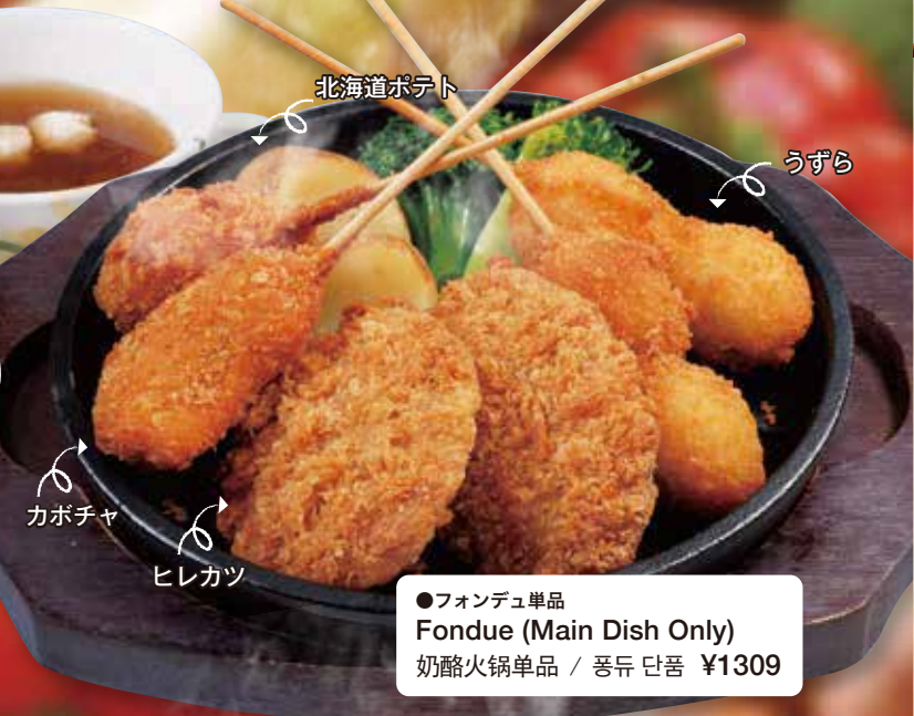
●フォンデュ単品 Fondue (Main Dish Only) 奶酪火锅单品 / 풍류 단품 ¥1309