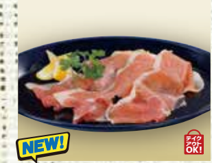
●生ハム (ハモンセラモ) dry-cured ham (jamón serrano) 干腌火腿 / 건식 햄 ¥913