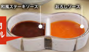
和風ステーキソース おろしソース