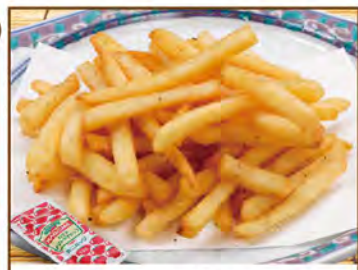
フライドポテト(のりしお) 390(税込429)