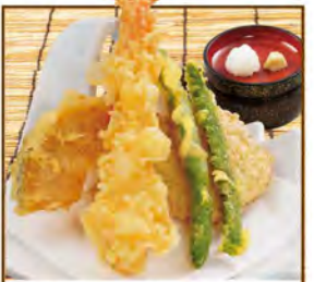
ちょっと天ぷら 430(税込473)