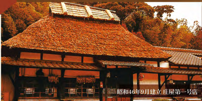
昭和46年9月建立 庄屋第一号店