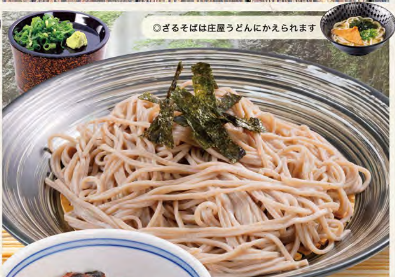
◎ざるそばは庄屋うどんにかえられます