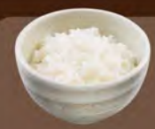
鶏めし 単品 350(税込385)