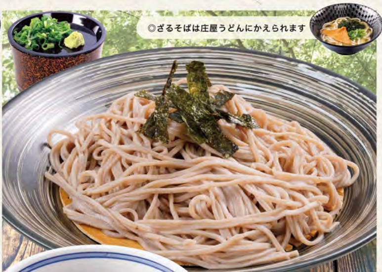
◎ざるそばは庄屋うどんにかえられます

ミニ づけ丼とざるそばセット ※わさび抜きをご希望の方はお申し付け下さい 1090(税込1199)