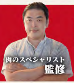
肉のスペシャリスト 監修