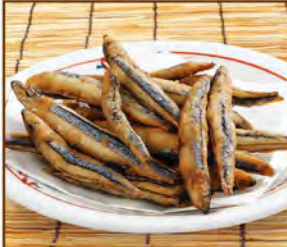
きびな唐揚げ 390(税込429)