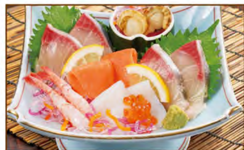
刺身盛り合わせ 1080(税込1188)