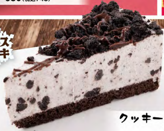
クッキー&クリームムース 690(税込759)

チョコクッキーを乗せた 滑らかアイスムースケーキ。 お好みでフルーツと合わせて どうぞ