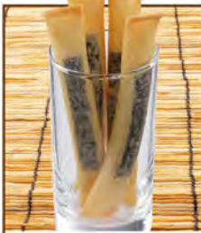
チーズフライ 390(税込429)