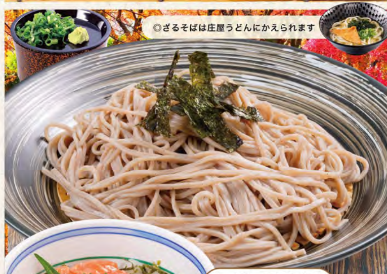
◎ざるそばは庄屋うどんにかえられます