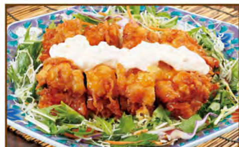
野菜たっぷりチキン南蛮 630(税込693)