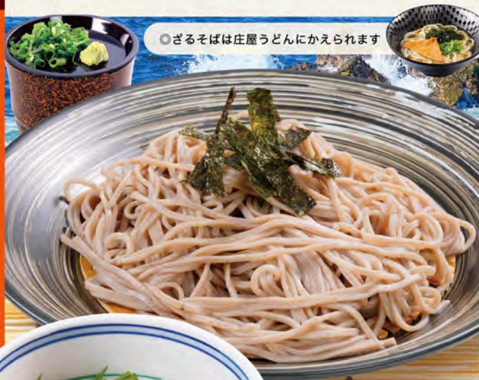
◎ざるそばは庄屋うどんにかえられます