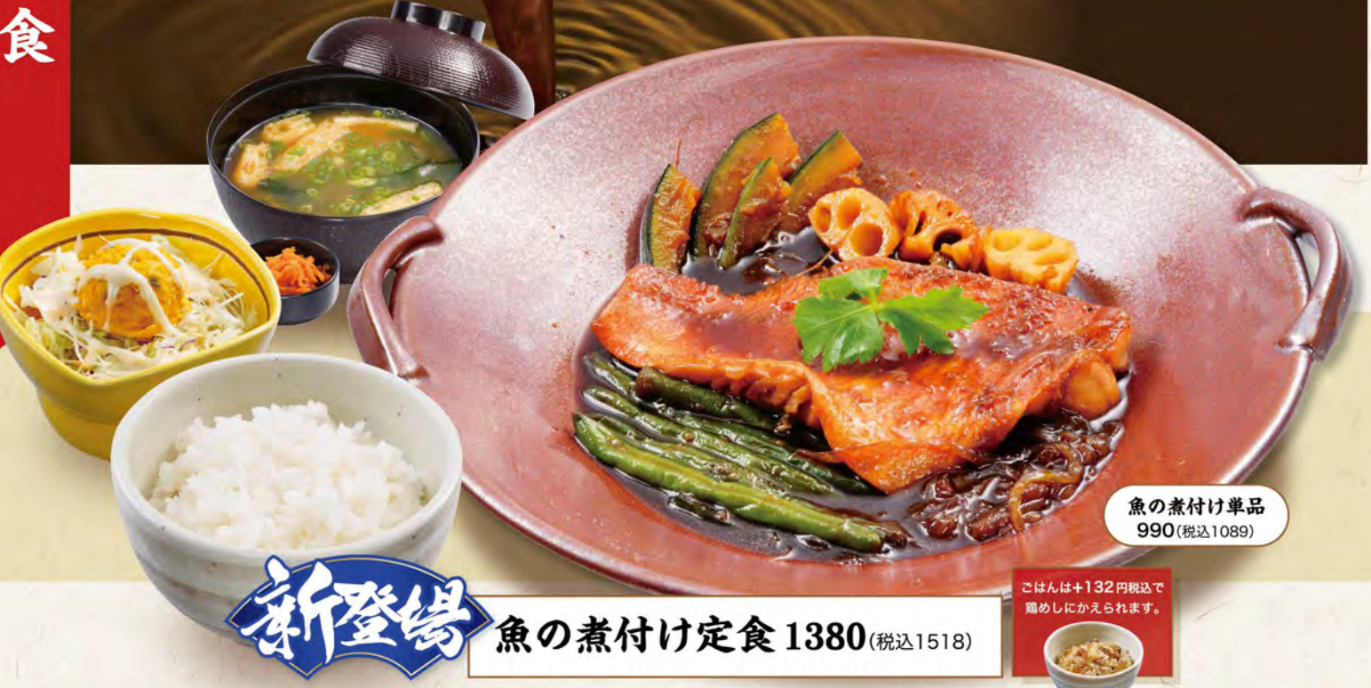
魚の煮付け単品 990(税込1089)

定食メニューのこだわり 『毎日』替わるお漬物！ 定食、セットメニューの漬物は、旬やおすめに合わせて毎日違う味で提供します。