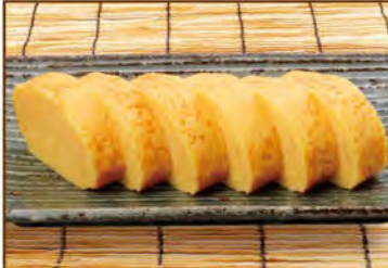
だし巻き玉子 390(税込429)