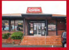
レストラン牛右衛門 本店

ハンバーグ・ステーキをはじめ、肉料理は洋食レストラン牛右衛門の知識と経験を活かしています。和食レストラン 蔵蔵庄屋との夢のコラボをどうぞ!