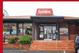
レストラン牛右衛門 本店

ハンバーグ・ステーキをはじめ、肉料理は洋食レストラン牛右衛門の知識と経験を活かしています。和食レストラン 蔵蔵庄屋との夢のコラボをどうぞ!