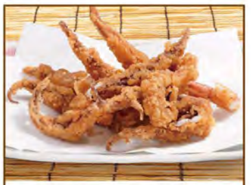
いかげその唐揚げ 580(税込638)