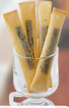
チーズスティック 480 (税込528)