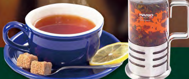
紅茶(ダーズリン) 590 (税込649) 約2杯分

ヒマラヤ山脈の高地で栽培される茶葉、ダーズリンの上品で芳醇な香りと風味をフレンチプレスでお楽しみください。