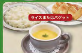
コーンスープセット