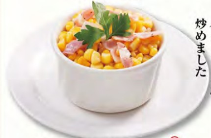
バターコーン 280 (税込308)