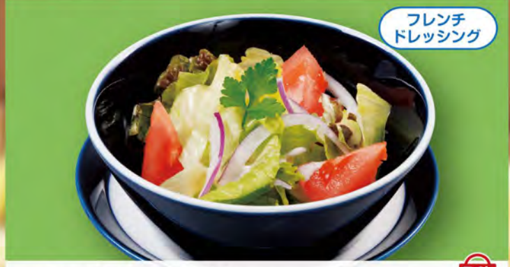
フレンチドレッシング