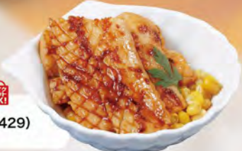
イカバター 390 (税込429)