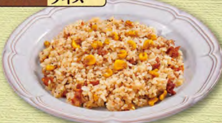
ガーリックライス 380(税込418)