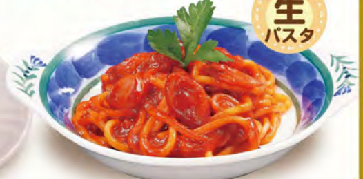
ミニナポリタン 480 (税込528)