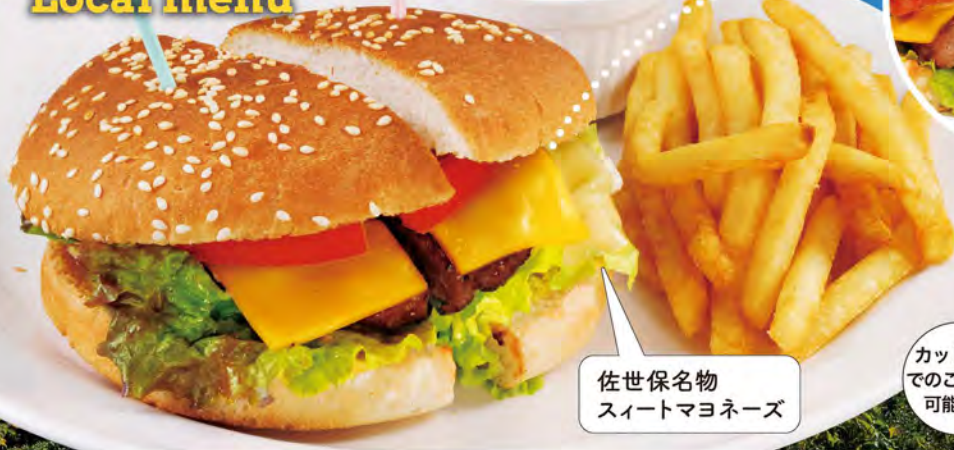
佐世保名物 スイートマヨネーズ