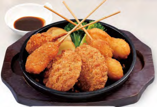
串揚げ 780 (税込858)