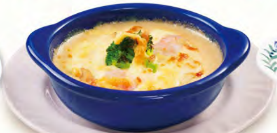
ミニグラタン 580 (税込638)