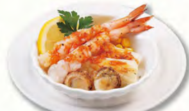
海鮮グリル 580 (税込638)