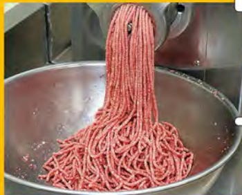
④ 厳しい選定と処理を経て、上質な挽き肉の出来上がり