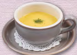
コーンカップスープ 230 (税込253)