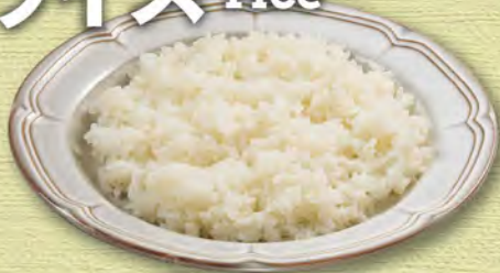
ライス(ごはん) (中)230(税込253) (小)200(税込220)