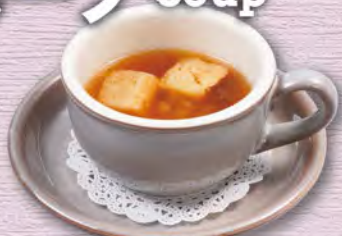
オニオンカップスープ 180 (税込198)