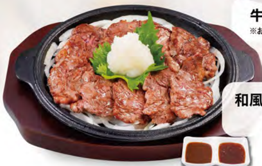
和風ヒレステーキ 1290 (税込1419)