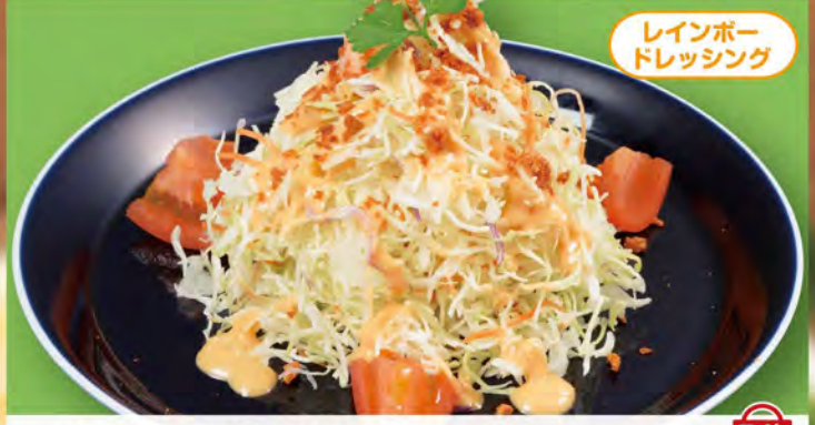
レインボードレッシング