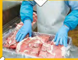
③ 挽き肉にするためにスライスし、肉質にはばつきがないよう整える