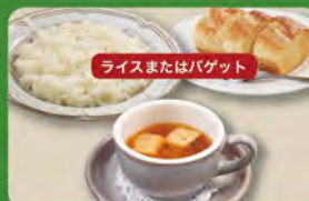
オニオンスープセット