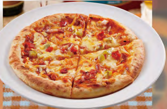
ミックスピザ (直径20cm) 880 (税込968) もっちりした食感の生地に、サラミやベーコン、2種のチーズをトッピング