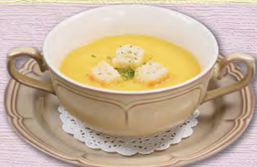
コーンポタージュ(ポウル) 300 (税込330)