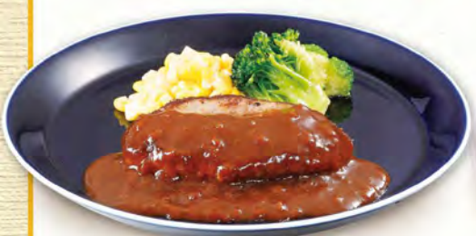
ミニハンバーグ 430 (税込473)