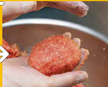
⑤ 手ごね 毎日各店舗に届けられ、キッチンにて一つ一つ丁寧に手ごねされます