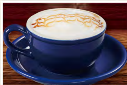
キャラメルカプチーノ 590 (税込649)