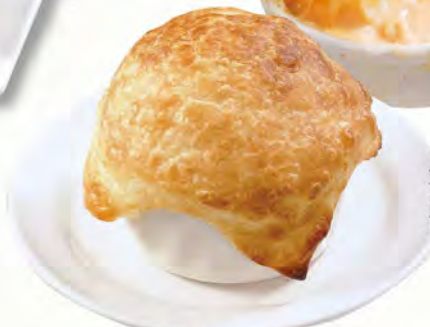
パイ包みグラタン 480 (税込528)