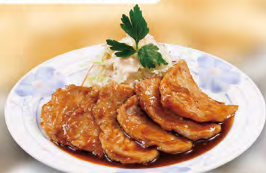
特製しょうが焼き 780 (税込858)