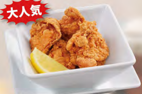
フライドチキン(5個) 480 (税込528) 牛右衛門秘伝のたれで漬けています。