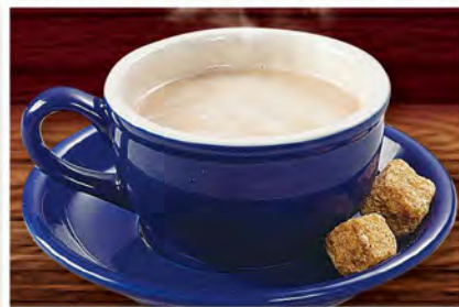
カフェラテ 590 (税込649)