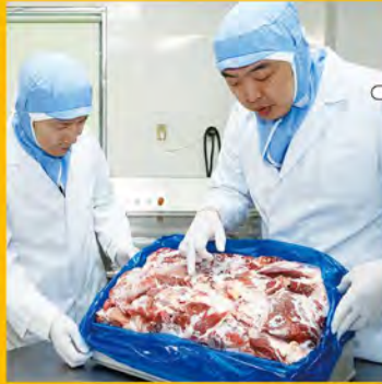
① 当社取締役が、提携工場の材料の品質チェックを定期的実施