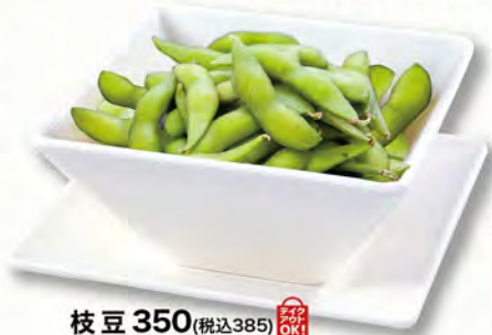
枝豆 350 (税込385)