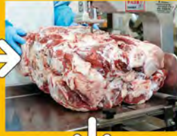
② 厳選した牛肉から更に余分な部分をカット