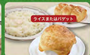
パイ包みグラタンセット