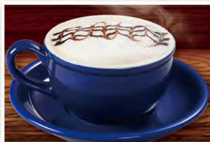
カフェモカ 590 (税込649)