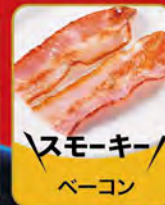
スモーキー ベーコン