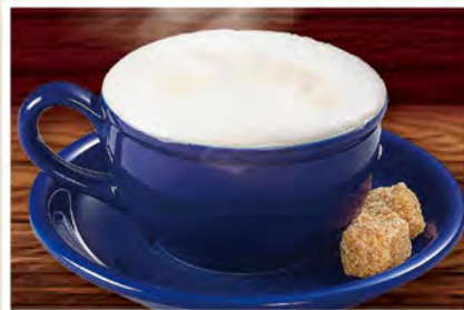
カプチーノ 590 (税込649)