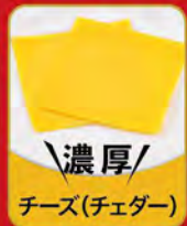
濃厚 チーズ(チェダー)