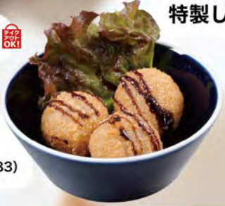
ライスコロケ トリュフ風味 530 (税込583)