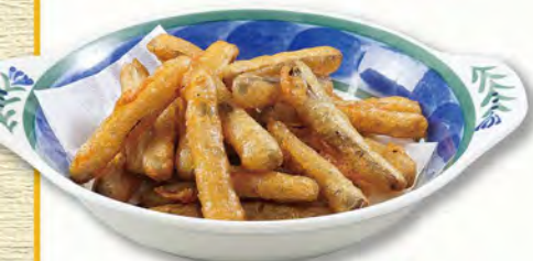
ごぼうの唐揚げ 430 (税込473)