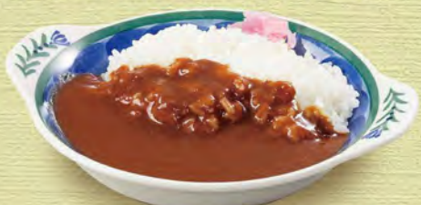
ミニカレーライス 430(税込473)