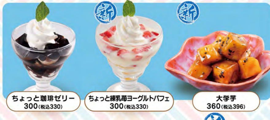
ちょっと珈琲ゼリー 300(税込330)