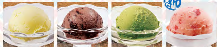
バニラアイス 280(税込308)