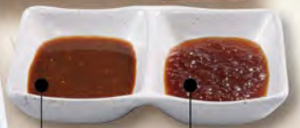
味噌玉ねぎソース | 醤油玉ねぎソース