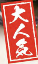
味噌玉ねぎソース 醤油玉ねぎソース