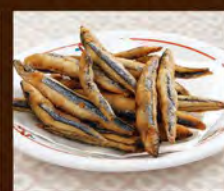
きびな唐揚げ 390(税込429)