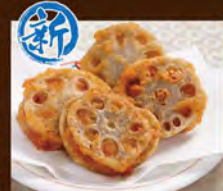
蓮根はさみ揚げ 480(税込528)