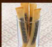
チーズフライ 390(税込429)