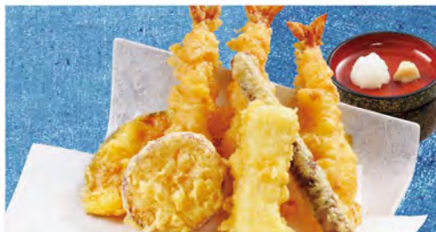
天ぷら盛り合わせ 880(税込968)