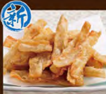
ごぼうチップス 580(税込638)