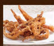
いかげその唐揚げ 580(税込638)