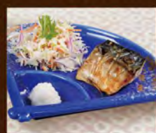
さばの塩焼き 230(税込253)