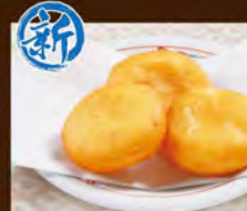
もちチーズ(カマンベール) 580(税込638)