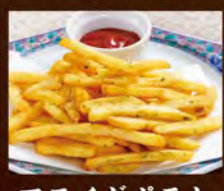
フライドポテト (のりしお) 390(税込429)