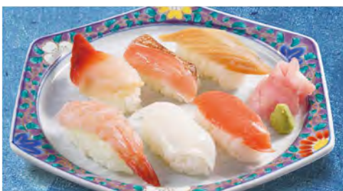
寿司6貫 530 (税込583)