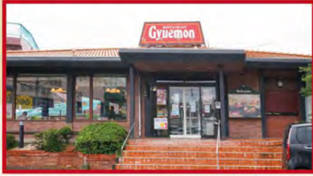
昭和54年創業 レストラン牛右衛門 大塔店 佐世保市大塔町