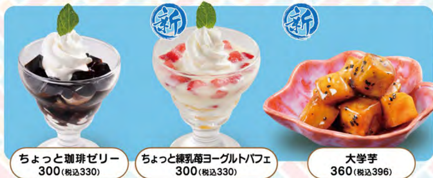
ちょっと珈琲ゼリー 300(税込330)