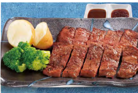
ステーキ単品 930 (税込1023)