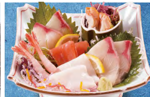
刺身盛り合わせ 990 (税込1089)