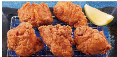
からあげ 480 (税込528)