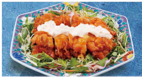
野菜たっぷりチキン南蛮 630 (税込693)