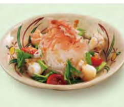
大根サラダ 290 (税込319)