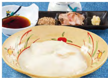
すくい豆腐 390 (税込429)