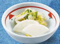
お漬物 150 (税込165) 内容が変わる場合がございます。