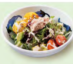
庄屋サラダ 480 (税込528)