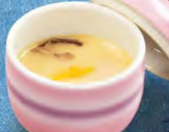
茶碗蒸し 290 (税込319)