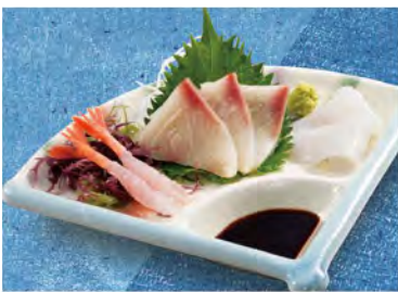
刺身3品盛り 590 (税込649)