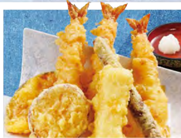
天ぷら盛り合わせ 880 (税込968)