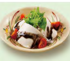
豆腐サラダ 390 (税込429)