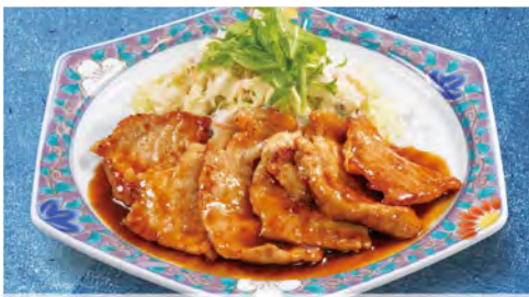
しょうが焼き 730 (税込803)