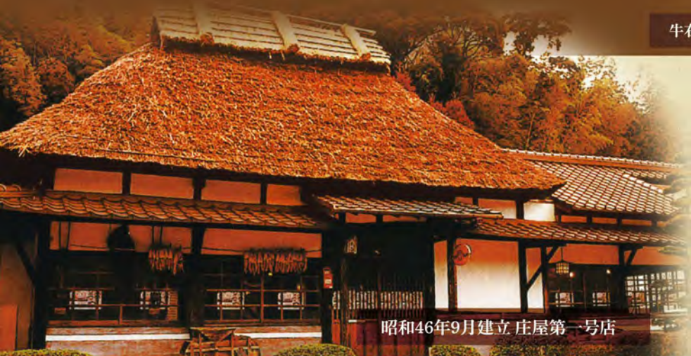
昭和46年9月建立 庄屋第一号店