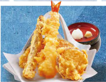
ちょっと天ぷら 430 (税込473)