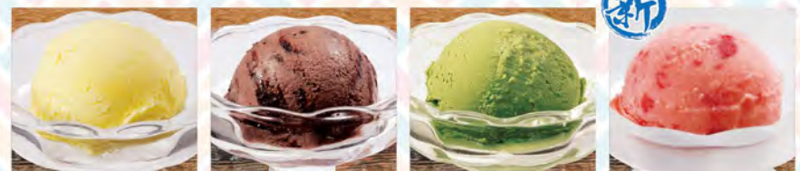
バニラアイス 280(税込308)