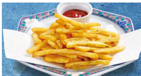
フライドポテト(のりしお) 390 (税込429)