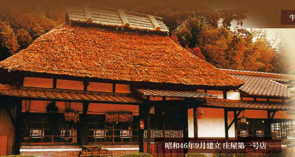
昭和46年9月建立 庄屋第一号店