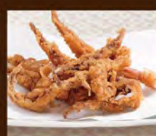
いかげその唐揚げ 580(税込638)