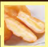
外はサクッと中はチーズがとろ〜り