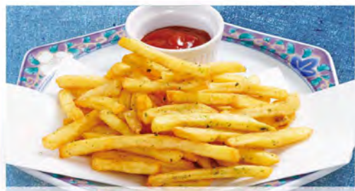
フライドポテト(のりしお) 390(税込429)