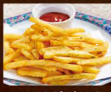
フライドポテト(のりしお) 390(税込429)