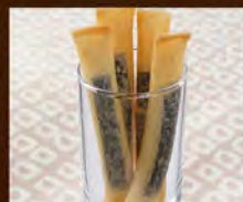
チーズフライ 390(税込429)