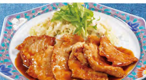
しょうが焼き 730(税込803)