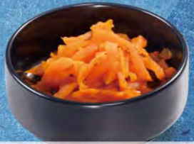
お漬物 150(税込165) ※内容が変わる場合がございます