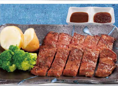
ステーキ単品 930(税込1023)