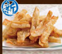
ごぼうチップス 580(税込638)