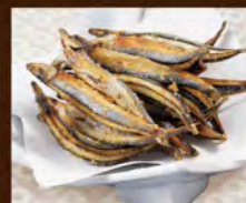
きびな唐揚げ 390(税込429)