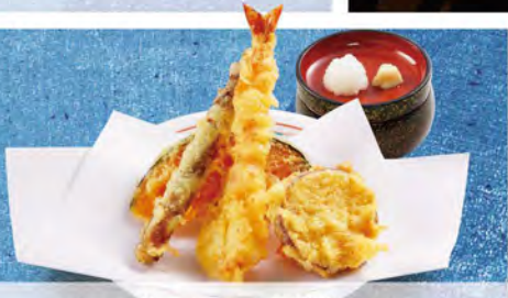
ちょっと天ぷら 430(税込473)