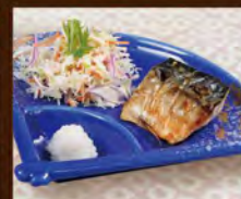
さばの塩焼き 230(税込253)