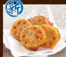
蓮根はさみ揚げ 480(税込528)