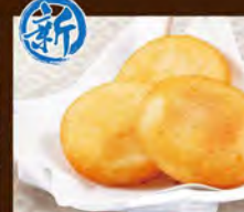
もちチーズ(カマンベール) 580(税込638)