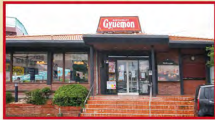
昭和54年創業 レストラン牛右衛門 大塔店 佐世保市大塔町