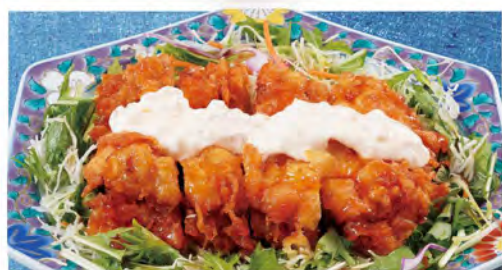
野菜たっぷりチキン南蛮 630(税込693)