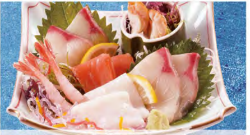
刺身盛り合わせ 990(税込1089)