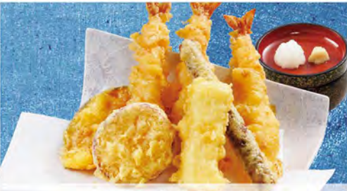
天ぷら盛り合わせ 880(税込968)