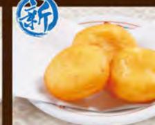
もちチーズ(カマンベール) 580(税込638)