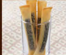
チーズフライ 390(税込429)