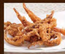
いかげその唐揚げ 580(税込638)