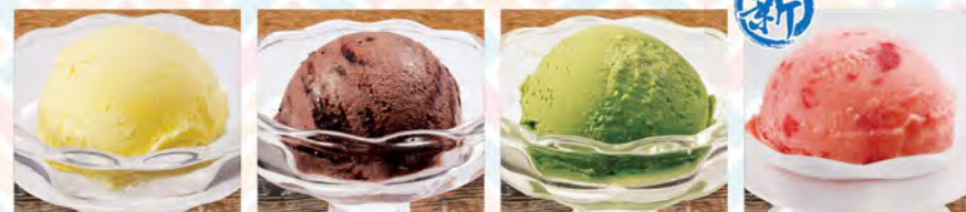
バニラアイス 280(税込308)