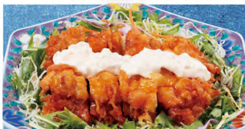
野菜たっぷりチキン南蛮 630(税込693)