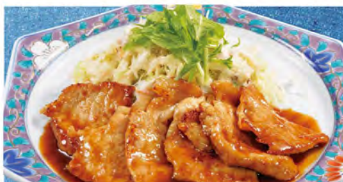
しょうが焼き 730(税込803)