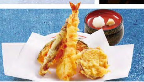
ちょっと天ぷら 430(税込473)