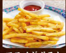
フライドポテト (のりしお) 390(税込429)