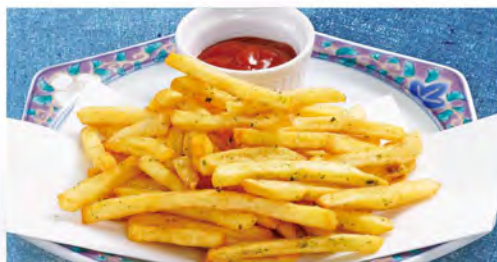
フライドポテト(のりしお) 390(税込429)