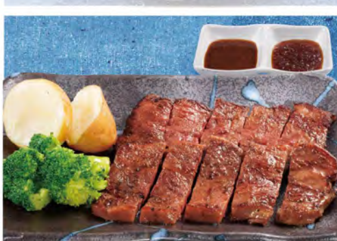
ステーキ単品 930(税込1023)