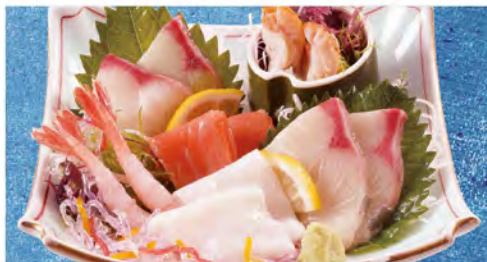
刺身盛り合わせ 990(税込1089)