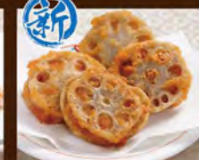
蓮根はさみ揚げ 480(税込528)