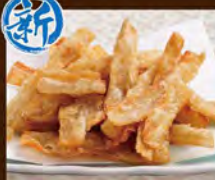
ごぼうチップス 580(税込638)