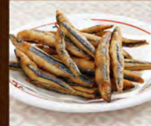
きびな唐揚げ 390(税込429)