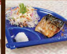
さばの塩焼き 230(税込253)