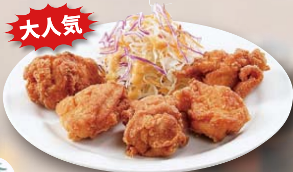
●フライドチキン Fried Chicken 炸鸡 / 후라이드 치킨 ¥473