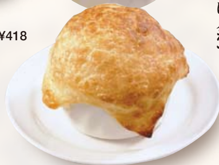
●パイ包みグラタン Baked Gratin in Pie 酥派裹奶汁烤菜 / 파이 그라탕 ¥528 ※器は熱くなっておりますのでご注意ください。