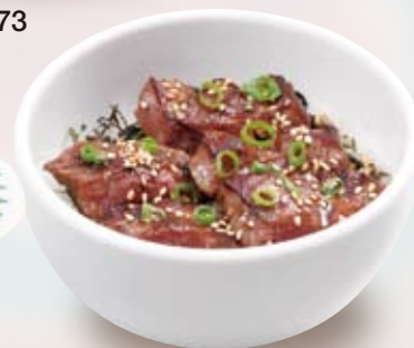
●ミニステーキ丼 Mini Steak Bowl 小份牛排盖浇饭 / 미니 스테이크丼 ¥638 ※お肉は漬け込みをすることでやわらかく 仕上げています。