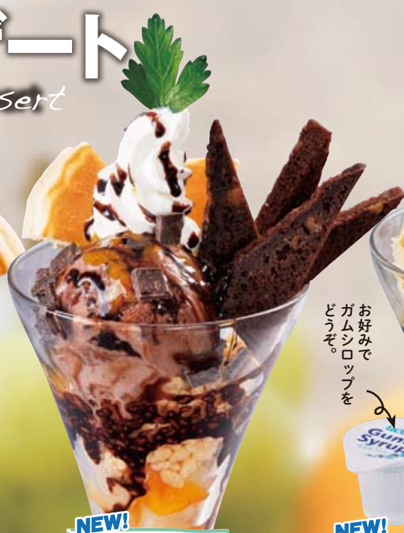
NEW! ● 特製チョコパフェ chocolate parfait 巧克力冻糕 / 초콜릿 파르페 ¥748