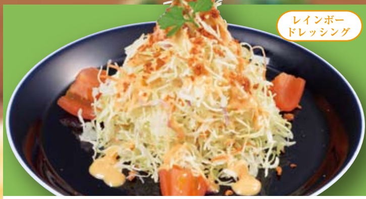
レインボードレッシング