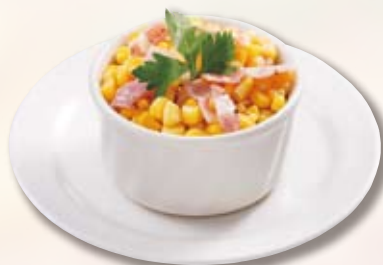
●バターコーン Butter Corn 黄油炒玉米 / 버터 콘 ¥308