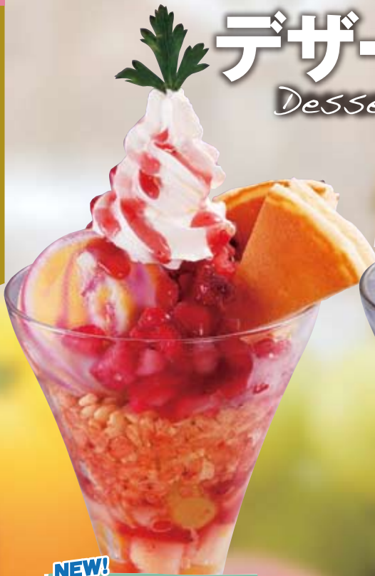
NEW! ● 莓マーブルパフェ Strawberry Marble Parfait 草莓大理石冻糕 / 딸기 마블 파르페 ¥594