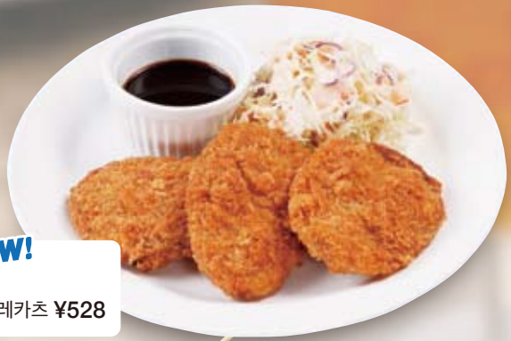
●ヒレカツ NEW! fillet cutlet 圓角肉排 / 힐레카츠 ¥528