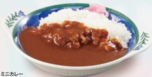
●ミニカレー Mini Curry and Rice 小份咖喱饭 / 미니 카레 ¥473