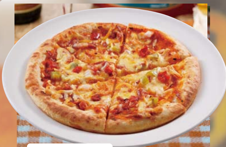
●ミックスピザ Mix Pizza 什锦披萨 / 믹스 피자 ¥748