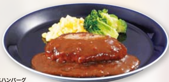
●ミニハンバーグ Mini Hamburger Steak 小份汉堡牛肉饼 / 미니 함바그 ¥473