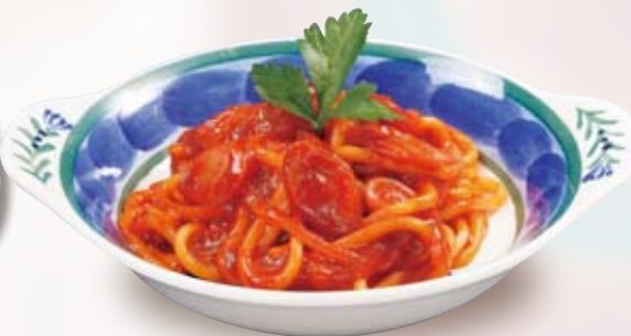
●ミニナポリタン Mini Spaghetti Neapolitan seasoned w/ Ketchup 小份番茄意面 / 미니 나폴리탄 ¥528