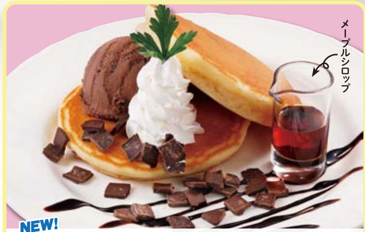
NEW! ● チョコレートパンケーキ chocolate pancake 巧克力煎饼 / 초콜릿 팬케이크 ¥759