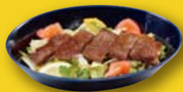
●ステーキサラダ steak salad 牛排沙拉 / 스테이크 샐러드 2人前 ¥715