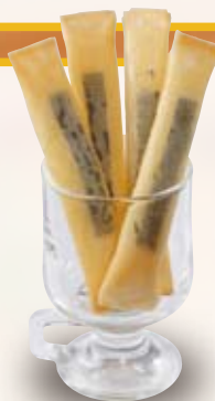
●チーズスティック Cheese Sticks 芝士条 / 치즈 스틱 ¥418