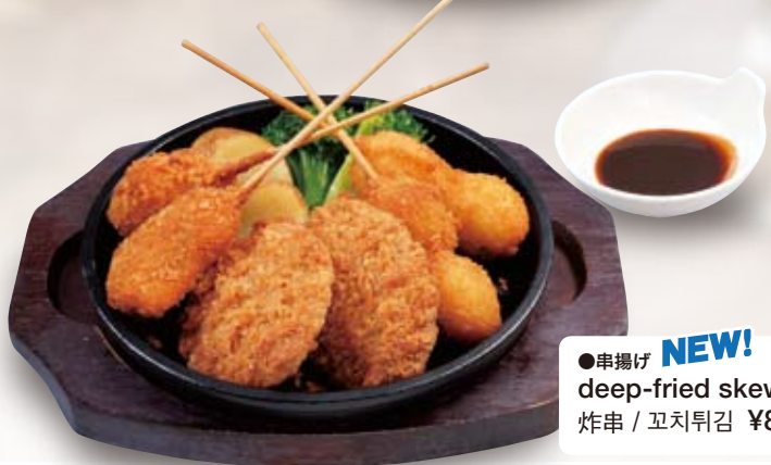
●串揚げ NEW! deep-fried skewers 炸串 / 꼬치튀김 ¥858