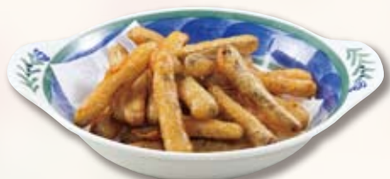
●ごぼうの唐揚げ Fried Burdock 干炸牛蒡 / 우엉튀김 ¥473