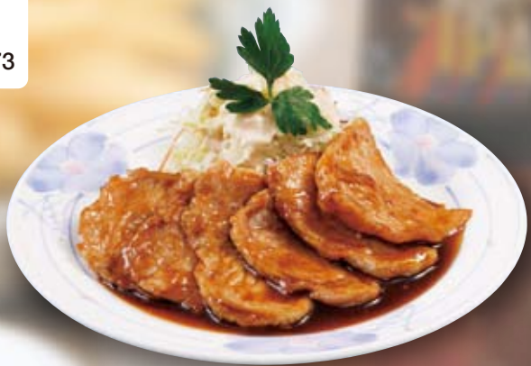
●特製しょうが焼き Ginger-Fried Pork 姜汁烤肉 / 돼지고기 생강 구이 ¥715