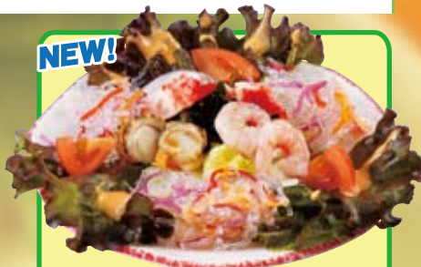
●ハーフ海の幸サラダ Half-Size Seafood Salad 半份海鮮沙拉 / 하프 해산물 샐러드 ¥638