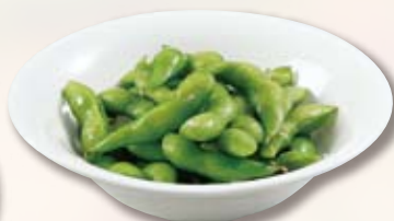
●枝豆 Green Soybeans 毛豆 / 완두콩 ¥385