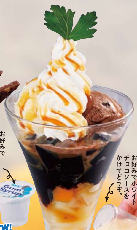
NEW! ● 코어-제리-파페 coffee jelly parfait 咖啡果冻冻糕 / 커피 젤리 파르페 ¥605