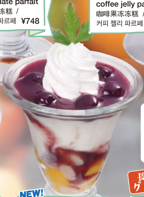
NEW! ● 블루베리-요거트-파페 blueberry yogurt parfait 蓝莓酸奶冻糕 / 블루베리 요거트 파르페 ¥495