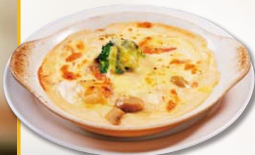
●ミニグラタン Mini Gratin 小份奶汁烤菜 / 미니 그라탕 ¥473 ※器は熱くなっておりますのでご注意ください。