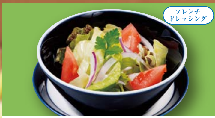
フレンチドレッシング