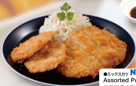
●ミックスカツ NEW! Assorted Pork Cutlets 炸物拼盘 / 믹스 카츠 ¥781