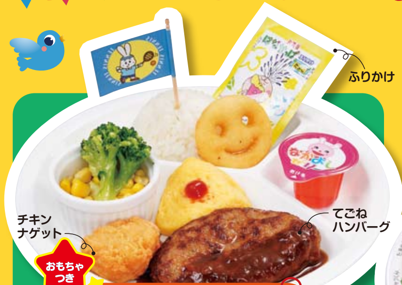
チキンナゲット ふりかけ てごねハンバーグ

●いろいろなえらべるおもちゃ Various Toy Selection 各种供选择的玩具 / 여러가지 고를수있는 장난감 ¥55