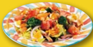
●アメリカンサラダ American Salad 美式沙拉 / 아메리카 샐러드 ¥715