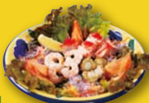
2人前 ●シーフードサラダ Seafood Salad 海鲜沙拉 / 해산물 샐러드 ¥1045