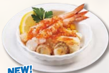
NEW! ●海鮮グリル Grilled Seafood 炙烤海鲜 / 해물 그릴 ¥638