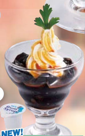
NEW! ● ミニコーヒーゼリー Mini Coffee Jello topped with Soft Cream 小份咖啡果冻 / 미니 커피 젤리 ¥330