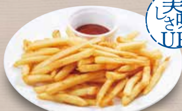
●フライドポテト French Fries 炸薯条 / 후렌치 후라이 ¥319