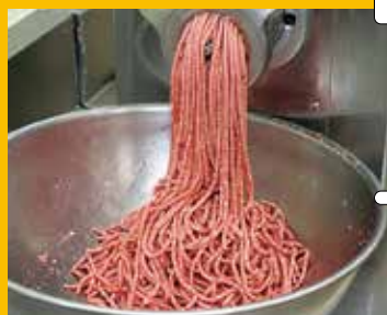
④ 厳しい選定と処理を経て、上質な挽き肉の出来上がり