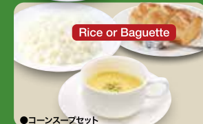
●コーンスープセット Corn Soup Set (Rice or Baguette & Corn Cup Soup) 玉米汤套餐 / 옥수수 수프 세트 ¥363