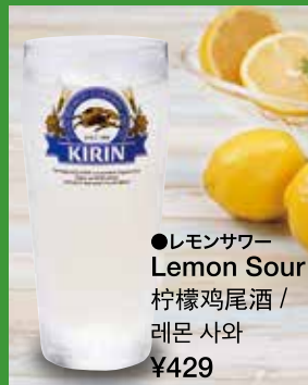
●レモンサワー Lemon Sour 柠檬鸡尾酒 / 레몬 사와 ¥429