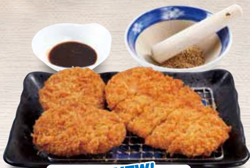
●ミックスカツ NEW! Assorted Pork Cutlets 炸物拼盘 / 믹스 카츠 ¥781