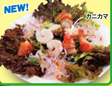
和風 ドレッシング