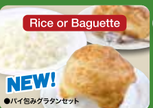
Baked Gratin in Pie Set NEW! 酥派裹奶汁烤菜套餐 / 파이 그라탕 세트 ¥638