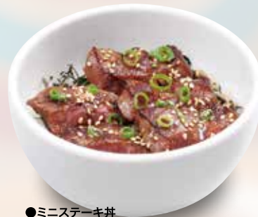
●ミニステーキ丼 Mini Steak Bowl 小份牛排盖浇饭 / 미니 스테이크丼 ¥638