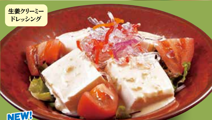
生姜クリーミー ドレッシング