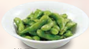
●枝豆 Green Soybeans 毛豆 / 완두콩 ¥385