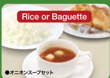
Onion Soup Set (Rice or Baguette & Onion Cup Soup) 洋葱汤套餐 / 알파 수프 세트 ¥308