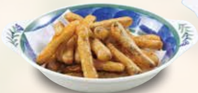
●ごぼうの唐揚げ Fried Burdock 干炸牛蒡 / 우엉튀김 ¥473