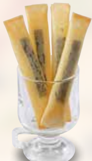
●チーズスティック Cheese Sticks 芝士条 / 치즈 스틱 ¥418