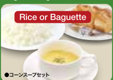
Corn Soup Set (Rice or Baguette & Corn Cup Soup) 玉米汤套餐 / 옥수수 수프 세트 ¥363