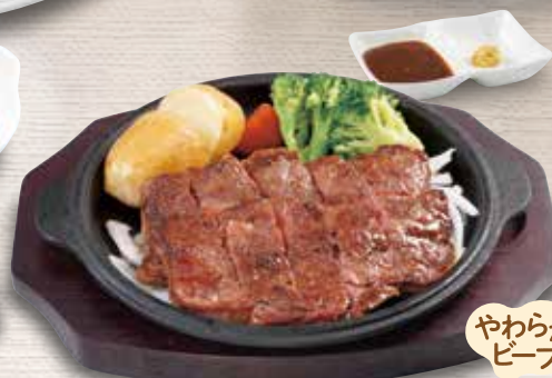
●和風ステーキ Beef Steak with Japanese Style Sauce 和风牛排 / 일본식 스테이크 ¥1089