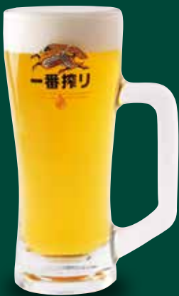
●生ビール(中ジョッキ) Draft Beer (Medium Mug) 生啤(中啤酒杯) / 생 맥주(중 조키) ¥649