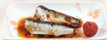
●いわしの梅煮 Simmered Sardine with Pickled Plums 梅子煮沙丁鱼 / 정어리조림 ¥572