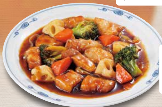
●黒酢豚 Black Vinegar Sweet & Sour Pork 黑醋糖醋里脊 / 흑당수육 ¥913