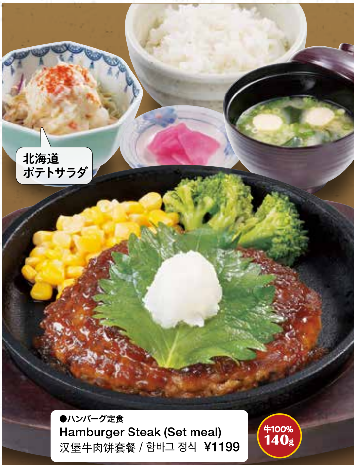
北海道 ポテトサラダ

●黒酢酢豚定食 Black Vinegar Sweet & Sour Pork (Set meal) 黒醋糖醋里脊套餐 / 흑탕수육 정식 ¥1188 ●黒酢酢豚単品 Black Vinegar Sweet & Sour Pork (Main dish only) 黒醋糖醋里脊単品 / 흑탕수육 단품 ¥913