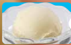
●バニラアイス Vanilla Ice Cream 香草冰淇淋 / 바닐라 아이스크림 ¥308