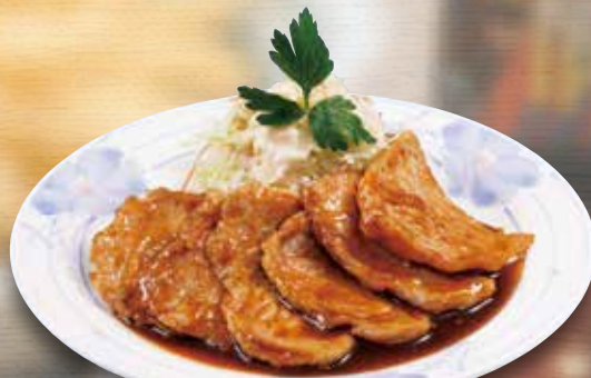
●特製しょうが焼き Ginger-Fried Pork 姜汁烤肉 / 돼지고기 생강 구이 ¥715