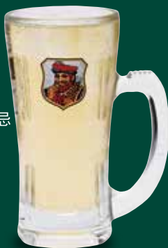
●ハイボール (ブラックニッカ) Highball (Black Nikka) 三得利角瓶威士忌 (黑色日华) / 하이볼(블랙니카) ¥539