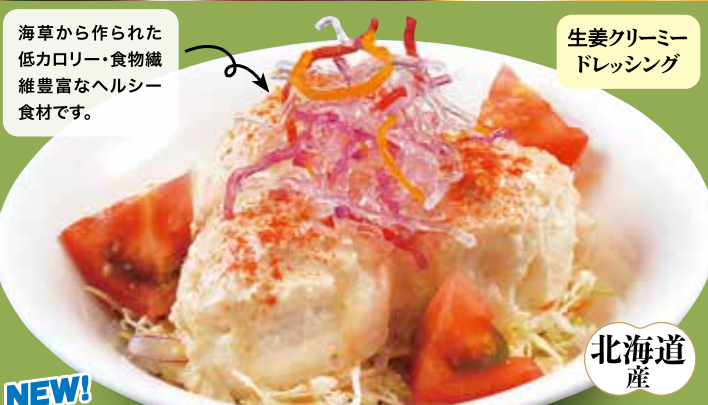
生姜クリーミー ドレッシング