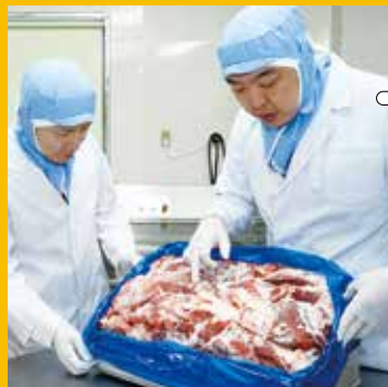
① 当社取締役が、提携工場の材料の品質チェックを定期的実施