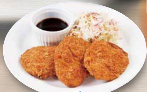
●ヒレカツ NEW! fillet cutlet 圆角肉排 / 힐레카츠 ¥528