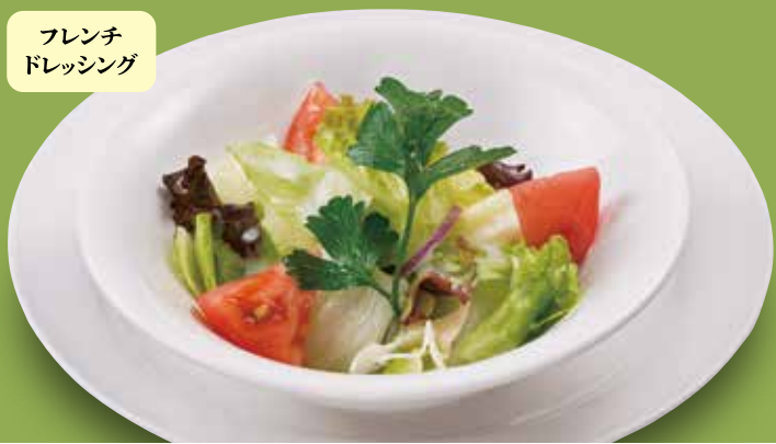
●ミニサラダ Small Salad 小份沙拉 / 미니 샐러드 ¥220