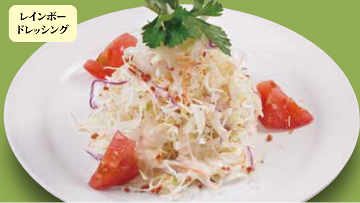
●キャベツのサラダ Cabbage Salad 卷心菜沙拉 / 양배추 샐러드 ¥253