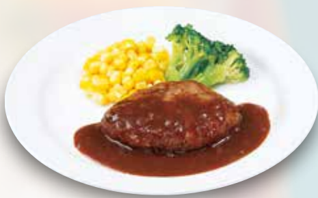
●ミニハンバーグ Mini Hamburger Steak 小份汉堡牛肉饼 / 미니 함바그 ¥473