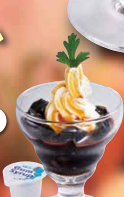
●ミニコーヒーゼリー NEW! Mini Coffee Jello topped with Soft Cream 小份咖啡果冻 / 미니 커피 젤리 ¥330