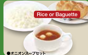
●オニオンスープセット Onion Soup Set (Rice or Baguette & Onion Cup Soup) 洋葱汤套餐 / 양파 수프 세트 ¥308