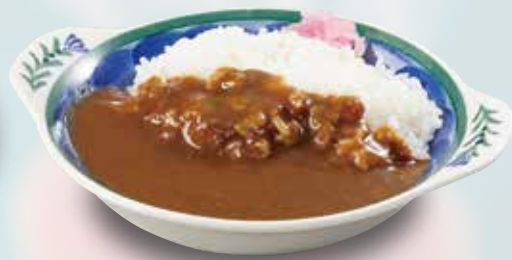
●ミニカレー Mini Curry and Rice 小份咖喱饭 / 미니 카레 ¥473