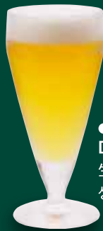
●生ビール(グラス) Draft Beer (Glass) 生啤(玻璃杯) / 생 맥주(글라스) ¥429