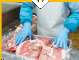
③ 挽き肉にするためにスライスし、肉質にばらつきがないよう整える