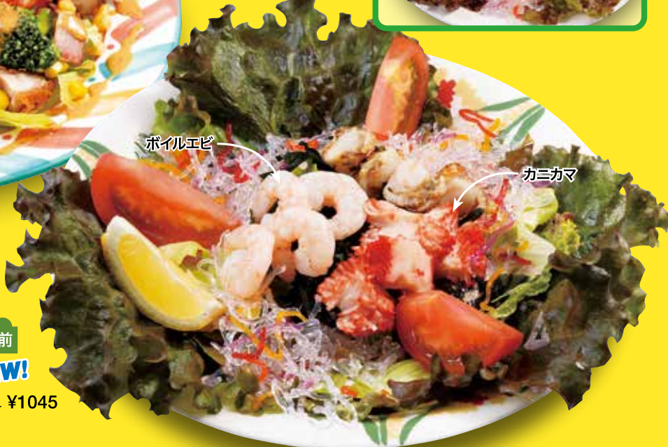
●海の幸サラダ Seafood Salad NEW! 海鮮沙拉 / 해산물 샐러드 ¥1045