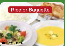
Dinner Set (Rice or Baguette, Salad & Soup in a bowl) 晚餐套餐 / 디너 세트 ¥583