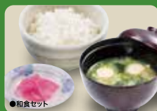
Rice & Miso Soup Set 日式套餐 / 일식 세트 ¥363