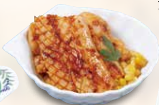
●イカバター Grilled Butter Squid 黄油炒鱿鱼 / 오징어 버터 ¥429