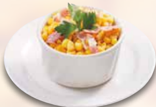
●バターコーン Butter Corn 黄油炒玉米 / 버터 콘 ¥308