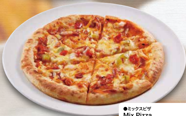
●ミックスピザ Mix Pizza 什锦披萨 / 믹스 피자 ¥748