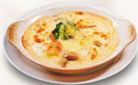
●ミニグラタン Mini Gratin 小份奶汁烤菜 / 미니 그라탕 ¥473