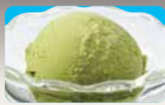
●宇治抹茶アイス Green Tea Ice Cream 抹茶味雪糕 / 우지말차 아이스 ¥308