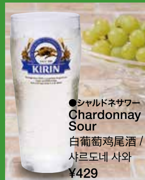
●シャルドネサワー Chardonnay Sour 白葡萄酒鸡尾酒 / 샤르도네 사와 ¥429