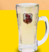
●ハイボール(ブラックニッカ) Highball (Black Nikka) 三得利角瓶威士忌 (黑色日华) / 하이볼(블랙니카) ¥539