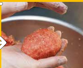
⑤ 手ごね 毎日各店舗に届けられ、キッチンにて一つ一つ丁寧に手ごねされます