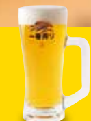
●生ビール(中ジョッキ) Draft Beer (Medium Mug) 生啤(中啤酒杯) / 생 맥주(중 조키) ¥649