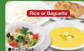
●ディナーセット Dinner Set (Rice or Baguette, Salad & Soup in a bowl) 晚餐套餐 / 디너 세트 ¥583