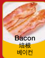
Bacon 培根 베이컨