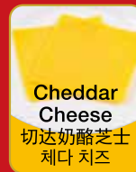
Cheddar Cheese 切达奶酪芝士 체다 치즈