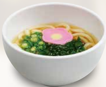
●ミニうどん Mini udon 小份乌冬面 / 미니 우동 ¥352