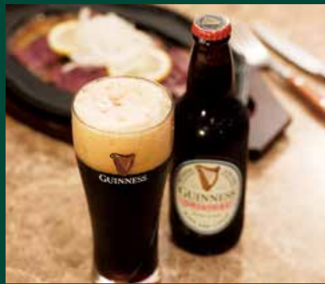
●黒ビール ギネススタウト Guinness Stout 健力士啤酒 / 기네스 스타우트 ¥649