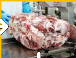
② 厳選した牛肉から更に余分な部分をカット