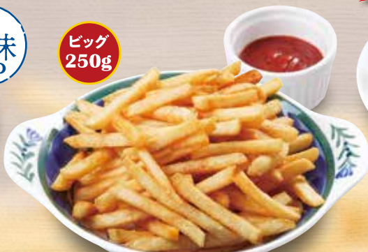
●大盛りポテト Large French Fries 大份炸薯条 / 후렌치 후라이 곱배기 ¥473