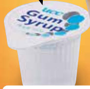
●コーヒーゼリーパフェ NEW! Coffee jelly parfait 咖啡果冻冻糕 / 커피 젤리 파르페 ¥605