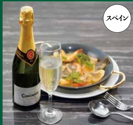
●白ワイン(ハーフボトル・375ml) White Wine (Half Bottle/375ml) 白葡萄酒(半瓶・375ml) / 화이트 와인(하프 보틀・375ml) ¥1408