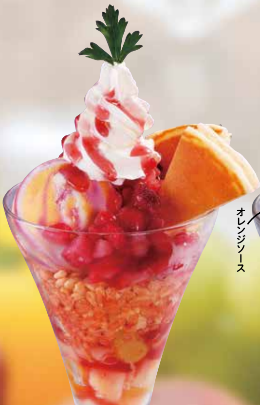
●莓マーブルパフェ NEW! Strawberry Marble Parfait 草莓大理石冻糕 / 딸기 마블 파르페 ¥594