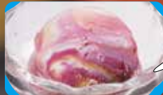
●ビビッドマーブルアイス Vivid Marble Ice Cream w/ Blackcurrants, Orange & Yogurt 黑加仑香橙酸奶味雪糕 / 비비드마블아이스 ¥308