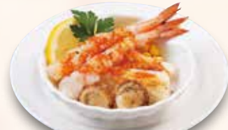
●海鮮グリル NEW! Grilled Seafood 炙烤海鲜 / 해물 그릴 ¥638