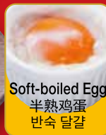
Soft-boiled Egg 半熟鸡蛋 반숙 달걀