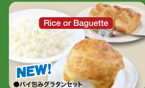
●パイ込みグラタンセット Baked Gratin in Pie Set 酥派裹奶汁烤菜套餐 / 파이 그라탕 세트 ¥638