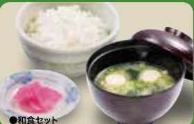
●和食セット Rice & Miso Soup Set 日式套餐 / 일식 세트 ¥363

Regular serving size of rice can be changed to small. [¥33 Off (incl. tax)]米饭可以换成小份米饭 (减去33日元含税) / 라이스(밥)은 라이스(소)로 변경 가능합니다.(33엔 할인) Large serving of rice is available with no additional cost. 米饭免费盛满 / 라이스(밥) 금액에는 무료입니다.