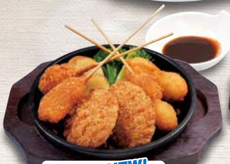
●串揚げ NEW! deep-fried skewers 炸串 / 꼬치튀김 ¥858