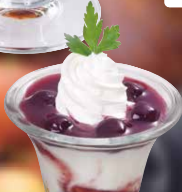
●ブルーベリーヨーグルトパフェ Blueberry yogurt parfait 蓝莓酸奶冻糕 / 블루베리 요거트 파르페 ¥495