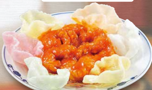
●エビチリ Stir-fried Shrimps in Chili Sauce 干烧明虾 / 칠리새우 ¥858