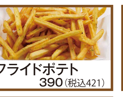
フライドポテト 390 (税込421)