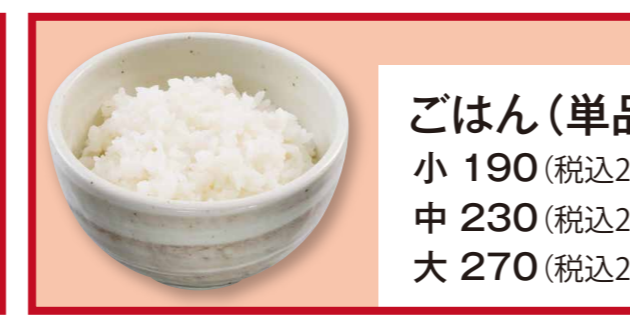
ごはん (単品) 小 190 (税込205) 中 230 (税込248) 大 270 (税込291)