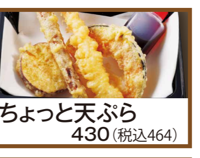
ちょっと天ぷら 430 (税込464)