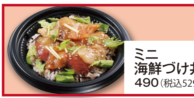
ミニ海鮮づけ丼 490 (税込529)