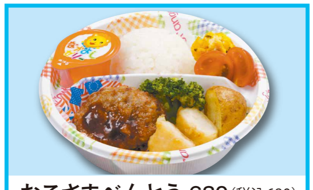
おこさまべんとう 630 (税込680)