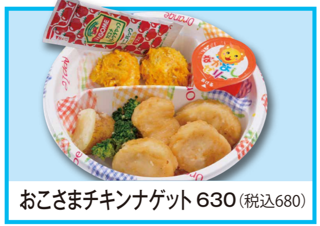
おこさまチキンナゲット 630 (税込680)