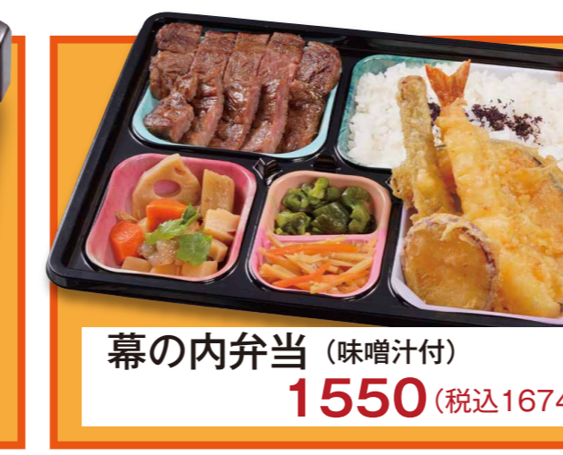
幕の内弁当 (味噌汁付) 1550 (税込1674)