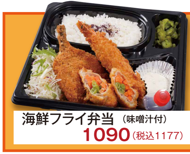
海鮮フライ弁当 (味噌汁付) 1090 (税込1177)