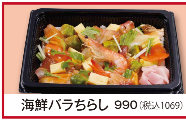
海鮮バラちらし 990 (税込1069)