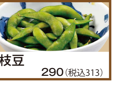
枝豆 290 (税込313)