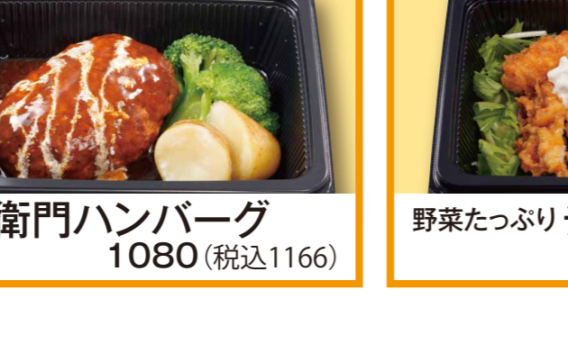
牛右衛門ハンバーグ 1080 (税込1166)