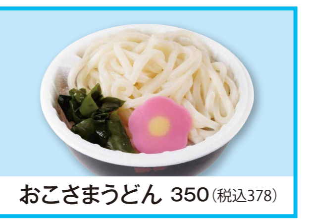
おこさまうどん 350 (税込378)