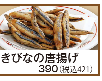
きびなの唐揚げ 390 (税込421)