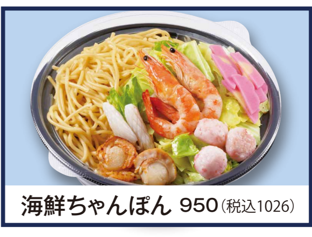
海鮮ちゃんぽん 950 (税込1026)