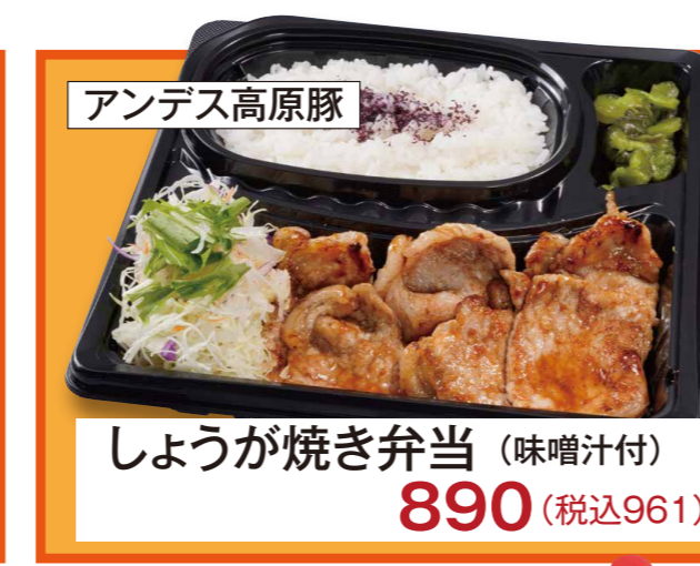
アンデス高原豚 しょうが焼き弁当 (味噌汁付) 890 (税込961)