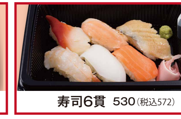
寿司6貫 530 (税込572)