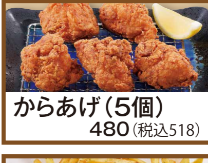
からあげ (5個) 480 (税込518)