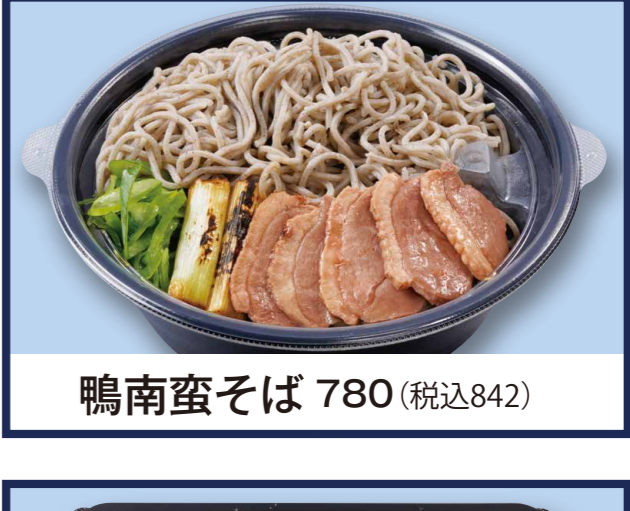
鴨南蛮そば 780 (税込842)