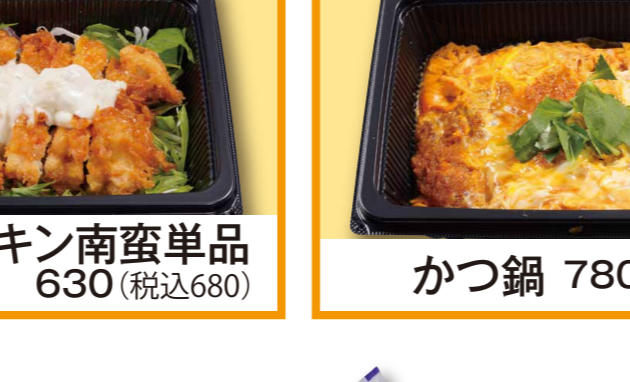
野菜たっぷりチキン南蛮単品 630 (税込680)