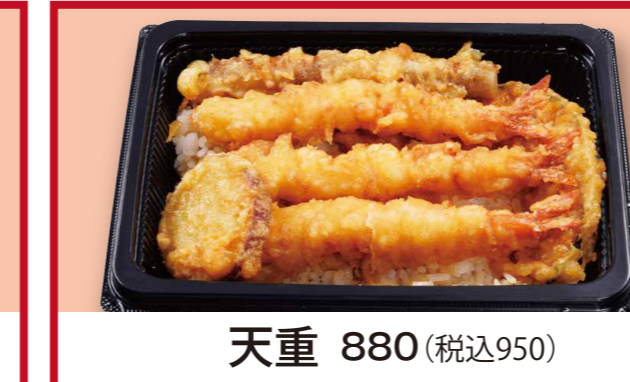
天重 880 (税込950)