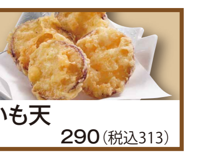
いも天 290 (税込313)