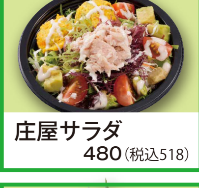
庄屋サラダ 480 (税込518)