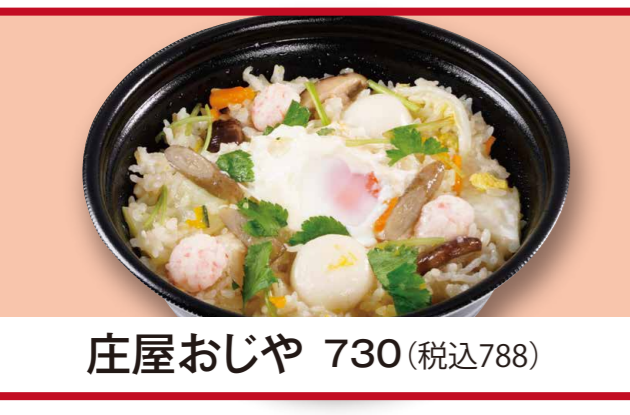
庄屋おじや 730 (税込788)