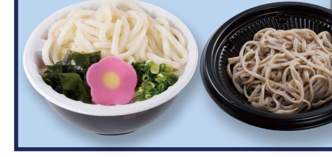
ミニうどん/ミニそば ミニざるうどん/ミニざるそば 各320 (税込345)