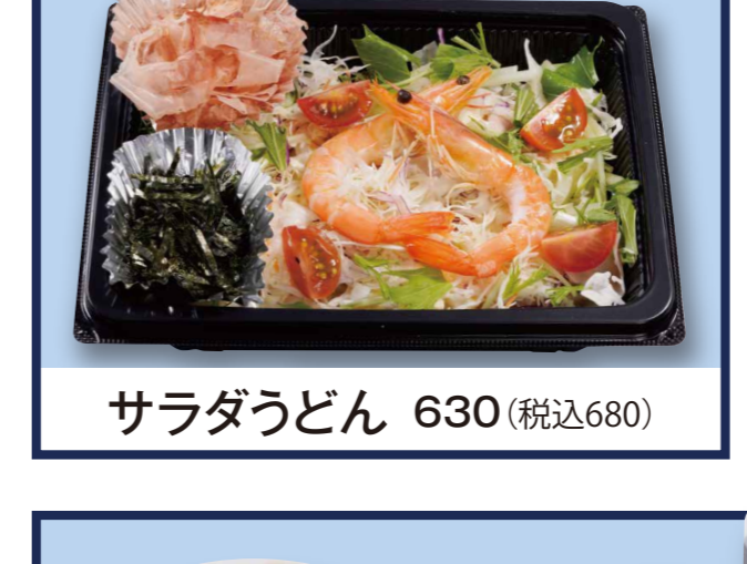
サラダうどん 630 (税込680)