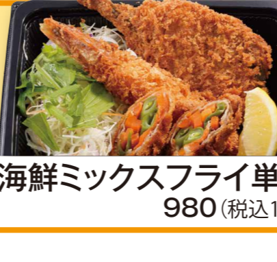
海鮮ミックスフライ単品 980 (税込1058)