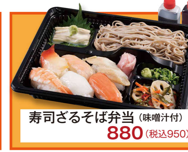
寿司ざるそば弁当 (味噌汁付) 880 (税込950)