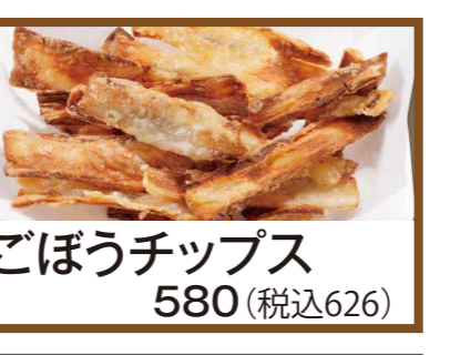
ごぼうチップス 580 (税込626)