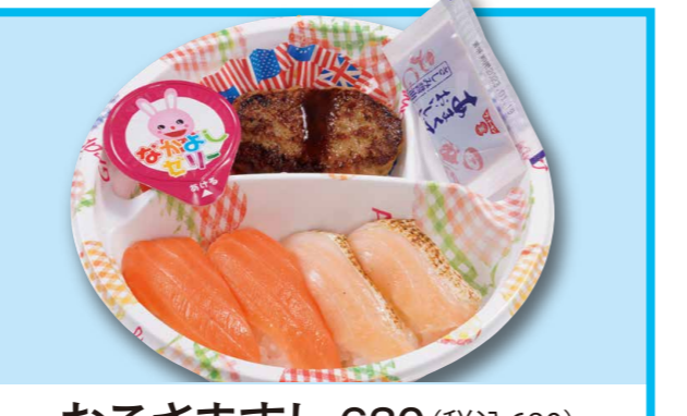
おこさますし 630 (税込680)