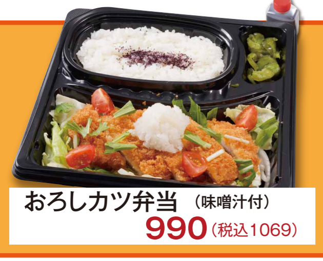
おろしカツ弁当 (味噌汁付) 990 (税込1069)