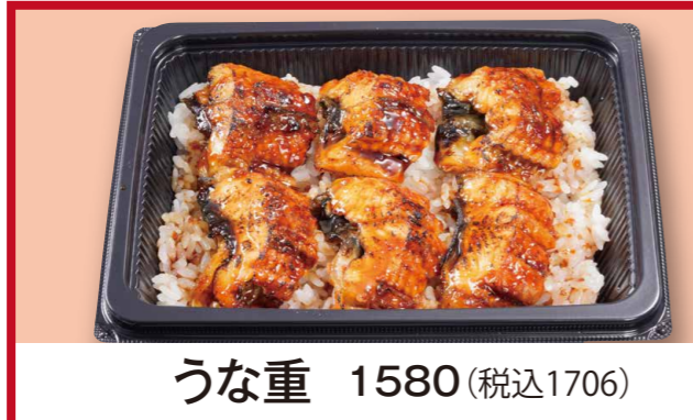
うなぎ 1580 (税込1706)