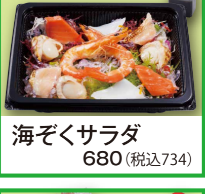
海ぞくサラダ 680 (税込734)