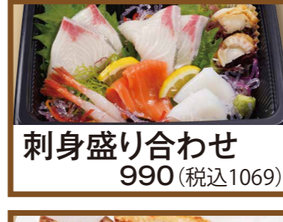
刺身盛り合わせ 990 (税込1069)