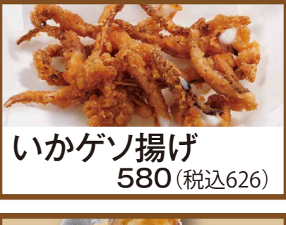
いかゲン揚げ 580 (税込626)