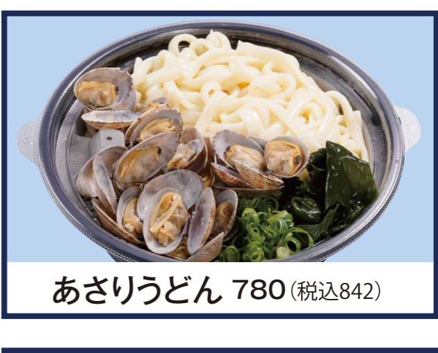
あさりうどん 780 (税込842)