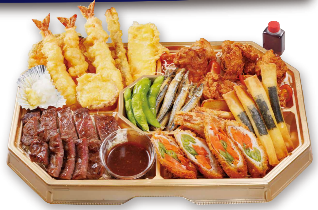
特選オードブル (3人前) 3300 (税込3564)