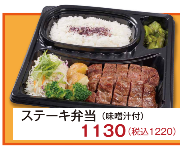
ステーキ弁当 (味噌汁付) 1130 (税込1220)