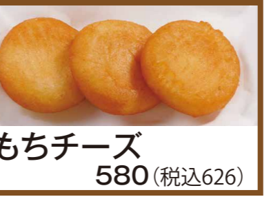
もちチーズ 580 (税込626)