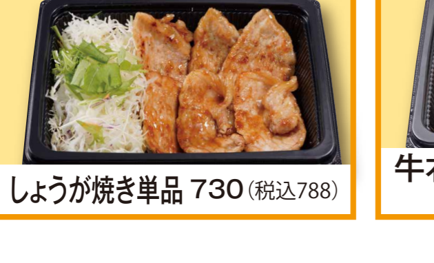
しょうが焼き単品 730 (税込788)