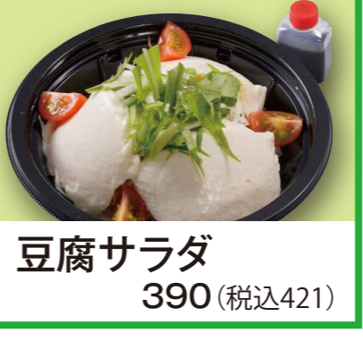
豆腐サラダ 390 (税込421)