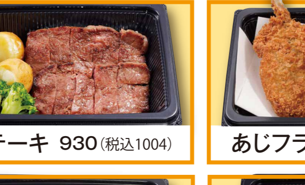
ステーキ 930 (税込1004)