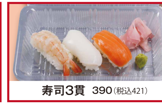
寿司3貫 390 (税込421)