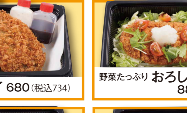
あじフライ 680 (税込734)