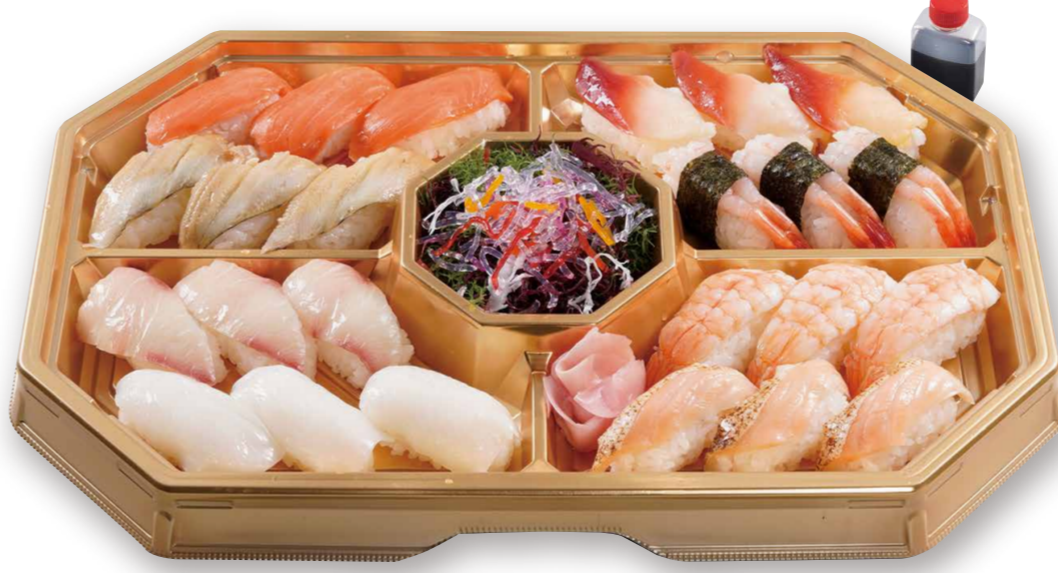
寿司盛合せ (3人前) 2480 (税込2678)

平日お昼・数量限定 \毎日替わる美味しさ / (味噌汁付) 日替ランチ弁当 680 (税込734) 写真は一例です。毎日内容が変わります。 数量限定のため売り切れの際はご了承ください。