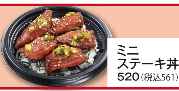
ミニステーキ丼 520 (税込561)