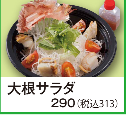
大根サラダ 290 (税込313)