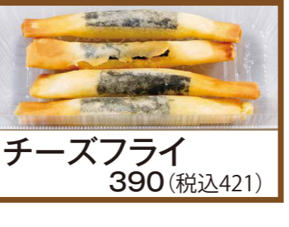
チーズフライ 390 (税込421)