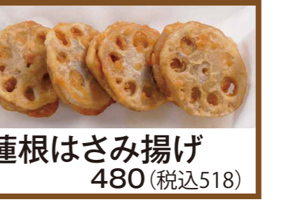
蓮根はさみ揚げ 480 (税込518)