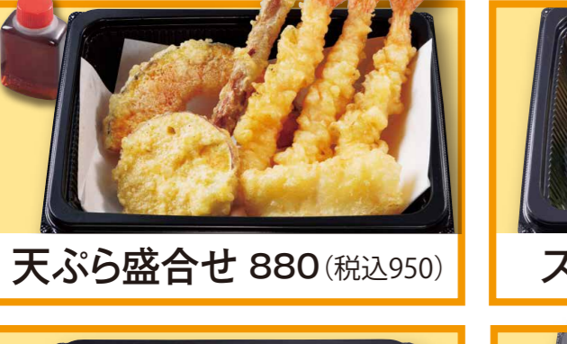
天ぷら盛合せ 880 (税込950)