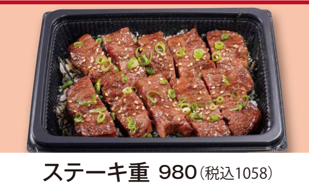
ステーキ重 980 (税込1058)