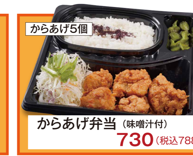
からあげ5個 からあげ弁当 (味噌汁付) 730 (税込788)