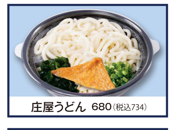
庄屋うどん 680 (税込734)