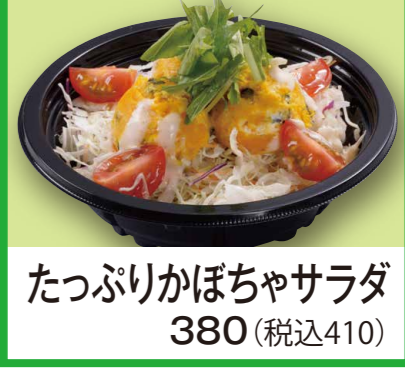
たっぷりかぼちゃサラダ 380 (税込410)