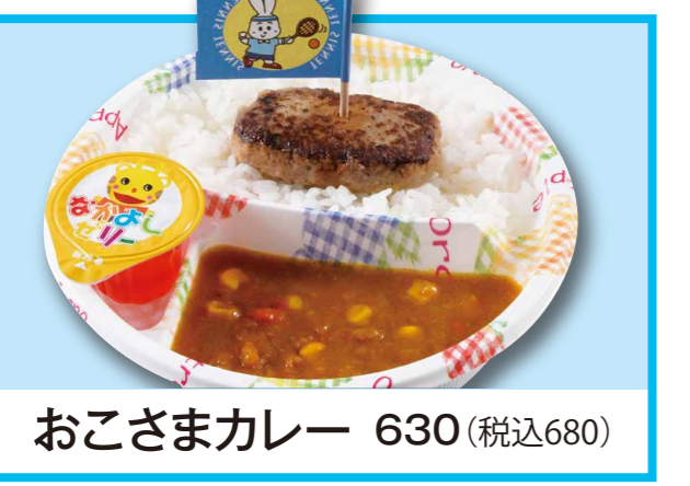
おこさまカレー 630 (税込680)