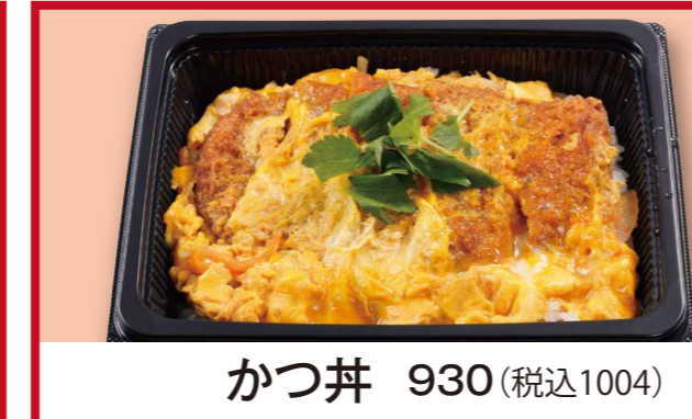
かつ丼 930 (税込1004)