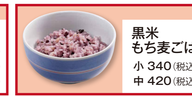
黒米もち麦ごはん 小 340 (税込367) 中 420 (税込453)