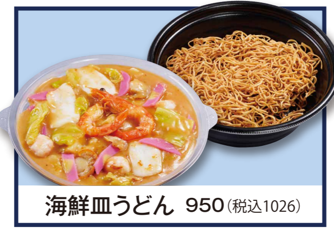
海鮮皿うどん 950 (税込1026)