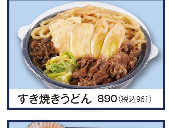
すき焼きうどん 890 (税込961)