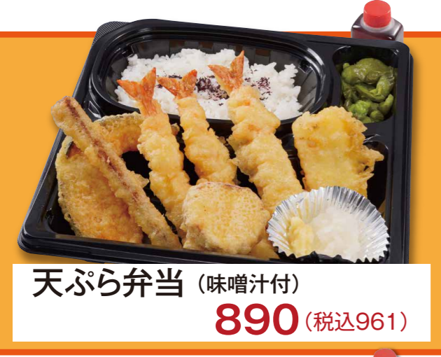
天ぷら弁当 (味噌汁付) 890 (税込961)