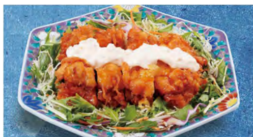
野菜たっぷりチキン南蛮 630 (税込693)