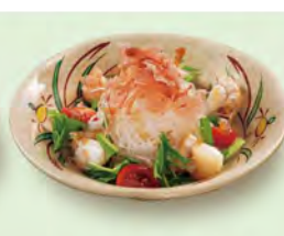
大根サラダ 290 (税込319)