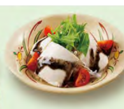
豆腐サラダ 390 (税込429)