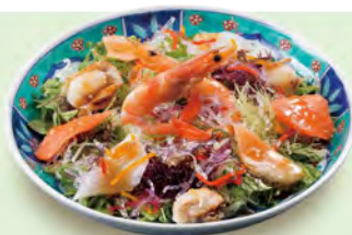
海ぞくサラダ 680 (税込748)