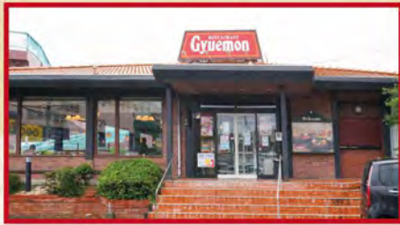
昭和54年創業 レストラン牛右衛門 大塔店 佐世保市大塔町