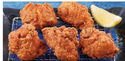
からあげ 480 (税込528)