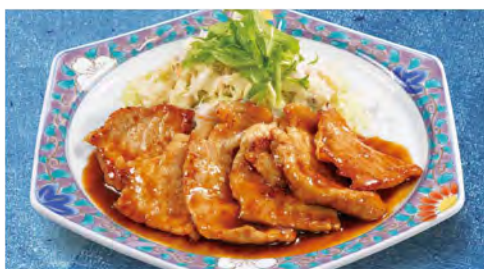
しょうが焼き 730 (税込803)