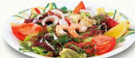
エビ、イカ、ホタテと海藻をトッピング。 和風ドレッシングで。 海の幸サラダ 630(税別)