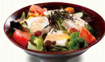
いろいろ野菜と豆腐を 香ばしい焙煎ごまドレッシングで。 豆腐のゴマドレサラダ 360(税別)