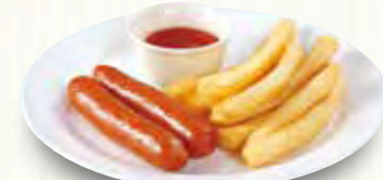
ソーセージ&フライドポテト 380(税別)