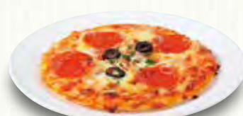
スモールピザ 380(税別)