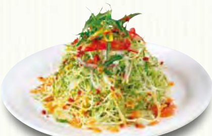
たっぷりキャベツのサラダに 甘口のサウザンアイランドドレッシングで。 キャベツサラダ 150(税別)