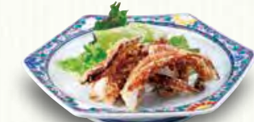
いかげその唐揚げ 430(税別)