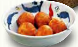
揚げたご焼き 360(税別)