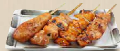
やきとり4本盛 690(税別) (モモ串・ネギマ・皮串・つくね各1本)