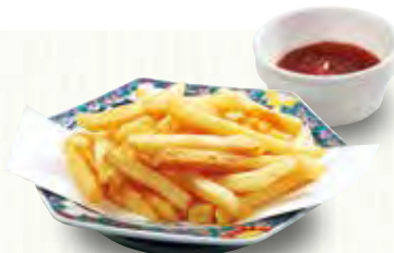
大盛りポテト 360(税別)