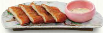
じゃこ天ぷら 280(税別)