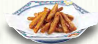
ごぼうの唐揚げ 280(税別)