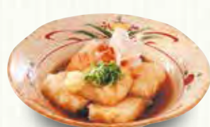
揚げ出し豆腐 280(税別)