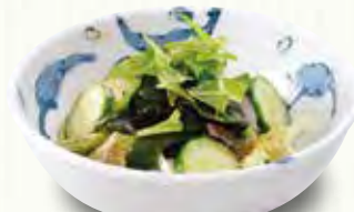
わかめとレタスのサラダ。 ちょっとサラダ 180(税別)