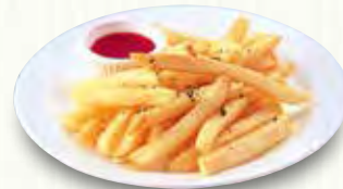
フライドポテト 230(税別)