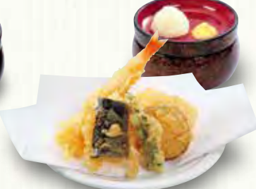
ちょっと天ぷら 380(税別)