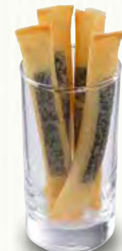
チーズスティック 360(税別)