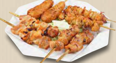
やきとり8本盛 1,380(税別) (モモ串・ネギマ・皮串・つくね各2本)